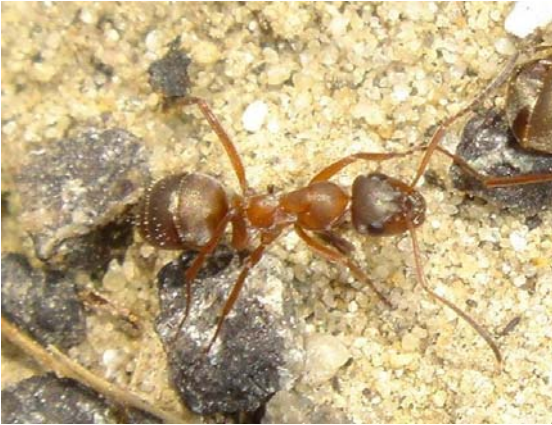
Figuur 5: Werkster van Formica cunicularia