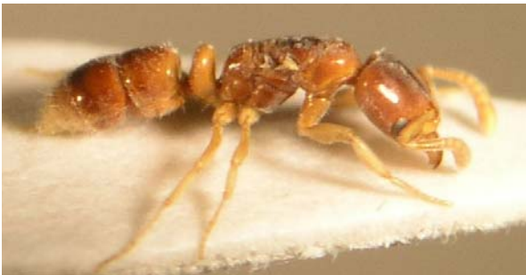
Figuur 4: Gyne van Hypoponera punctatissima

De discussie over het feit of we deze soort tot een van de inheemse soorten mogen rekenen werd opnieuw aangewakkerd toen de soort twee jaar na elkaar (1997 en 1998) in het Overbroek te Gelinden in de vrije natuur werd aangetroffen. De kolonie (enkele mannetjes, vleugelloze en gevleugelde wijfjes) was in een hoop maaisel gestationeerd. Waarschijnlijk zorgde verrotting van de maaiselhoop voor een ideale warme omgeving om de koude winter door te komen (VANKERKHOVEN, 1998; DEKONINCK & VANKERKHOVEN, 2001). Samen met het verwijderen van de maaiselhopen verdween daar waarschijnlijk ook een unieke plaats in Vlaanderen waar we de soort in de vrije natuur noteerden. Voor H. punctatissima biedt deze microhabitat blijkbaar ideale omstandigheden om zich buiten verwarmde gebouwen te handhaven (DELABIE & BLARD, 2002). Deze bevinding wordt door een recente waarneming bij ons en andere meldingen uit het buitenland ondersteund. Op het militair domein citadel te Diest werden 11 werksters gevonden in een hoop gehakseld hout in augustus 2007 (BERWAERTS et al., 2007) en in 2003 noteerde W. Dekoninck eveneens te Diest een ongevleugeld wijfje. Een zwervend wijfje is uiteraard geen aanwijzing voor een permanent verblijf in de vrije natuur maar meerdere werksters in een hoop haksel zijn dan weer wel een sterke indicatie dat deze mier de Nederlandse naam Compostmier dankt aan haar beschermend en verwarmd onderkomen in dit soort natuurlijke biotoop.