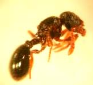
Figuur 2: Wijfje van Myrmecina graminicola

orchideeën gedomineerd vochtig blauwgrasland (DE BAKKER & DEKONINCK, 2001). In Wallonië is deze soort algemeen en kan ze op kalkbodems zeer hoge nestdichtheden halen.