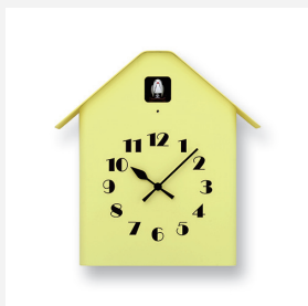
RF17-03 YE イエロー 4515030075783

RF17-03 寸法:w244×h252×d107mm 重量:1,550g 素材:無機質系人造木材、スチール 仕様:カッコー時計 音量2段階調整、ライトセンサー機能付 価格:20,000円+税