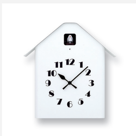
RF17-03 WH ホワイト 4515030075769