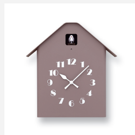
RF17-03 BW ブラウン 4515030075776