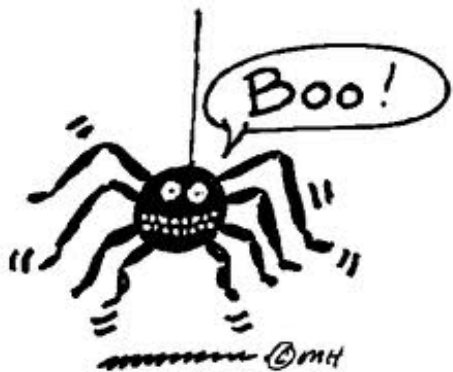
Zhī Zhū 蜘蛛