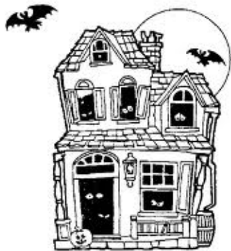
Guǐ Wū 鬼屋