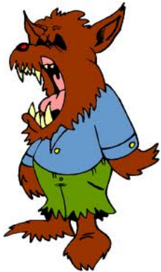
Láng Rén 狼人