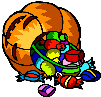
Táng Guǒ 糖果