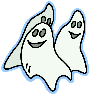
Guǐ Hún 鬼魂