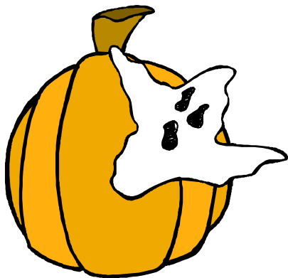
Wàn Shèng Jié 万圣节