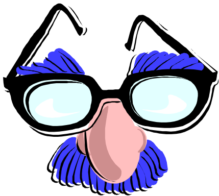
Fú Zhuāng 服装