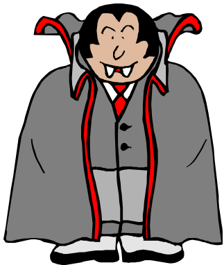
Xī Xuè Guǐ 吸血鬼