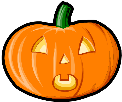
Nán Guā Dēng 南瓜灯