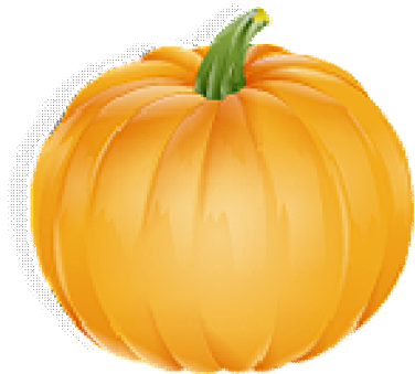
Nán Guā 南瓜