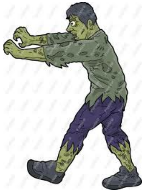
Jiāng Shī 僵尸