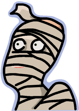
Mù Nǎi Yī 木乃伊