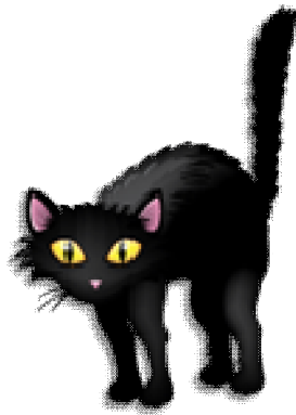
Hēi Māo 黑猫