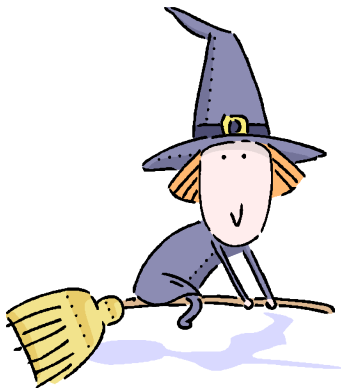
Wū Pó 巫婆