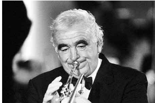
Maurice André 21 de mayo de 1933 - 25 de febrero de 2012