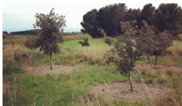
Aunque la trufa negra se mantiene con buenos niveles en todo tipo de plantaciones, cada vez se detectan más Tuber aestivum en plantaciones no valladas en las que los jabales se pasean libremente. Una razón más para recomendar el vallado inicial.

En otros trabajos no se observa una clara relación entre la cantidad de micelio extrarradicular y la formación de trufas, tanto en T. melanosporum , 135 como en T. magnatum . 136