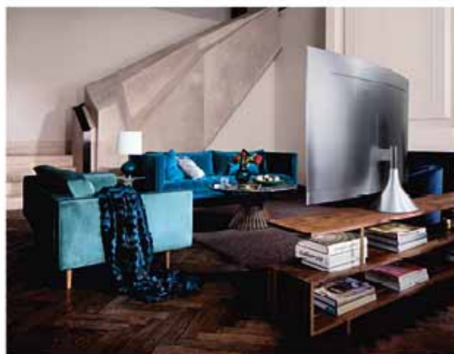
Pied « Gravity » VG-SGSM11S