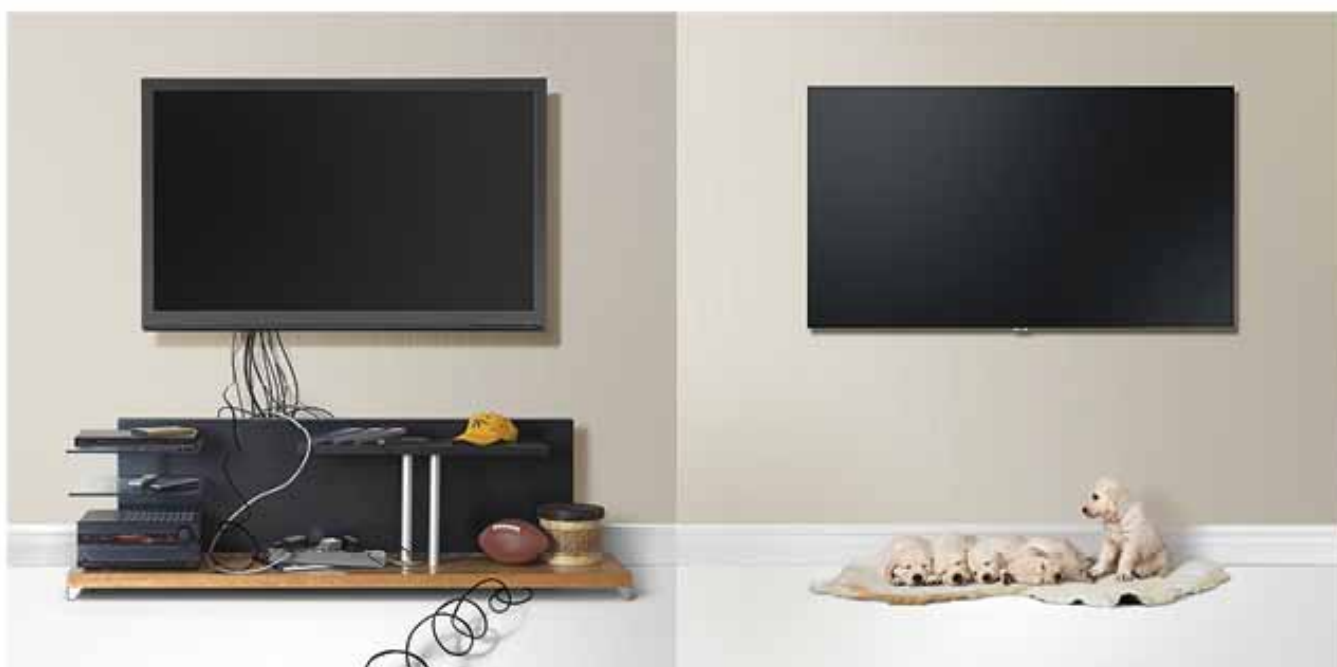
Accroches murales ultra fines WMN-M11EA (QLED de 49" à 65") et WMN-M21EA (QLED de 75")

Personnalisez votre TV : Choisissez votre design