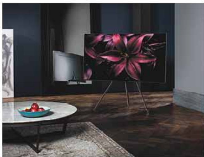
Pied « Studio » VG-STSM11B