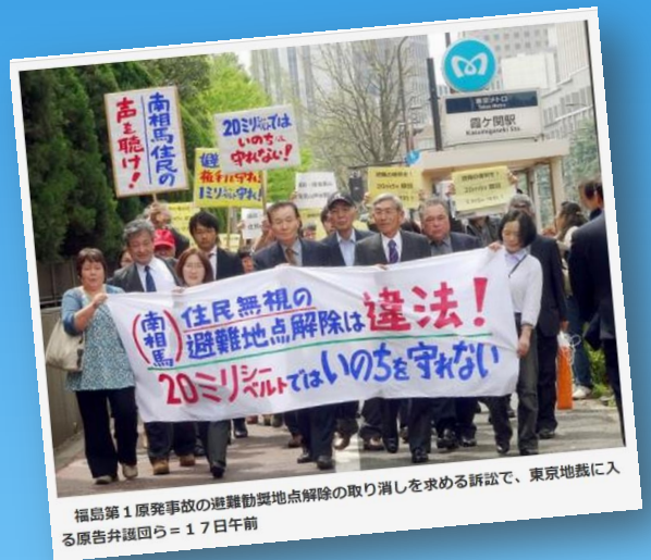
福島第1原発事故の避難動員地点解除の取り消しを求める訴訟で、東京地裁に入 る原告弁護団ら＝17日前

年20ミリシーベルトという避難基準、 社会的合意なき帰還促進政策——。 住宅支援の打ち切りなど、避難者に対する 「兵糧攻め」。 福島原発事故を「なかったこと」にし、 被ばく影響を無視する原子カムのたくら みに、みんなで立ち向かおう！