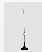
Extern antenn (kabel längd 3 m)