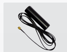
Utomhus GSM vandalsäker antenn