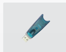
USB-nyckel SIM läs/skriv