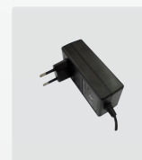
Ext. nätadapter 230V AC/14,6V DC