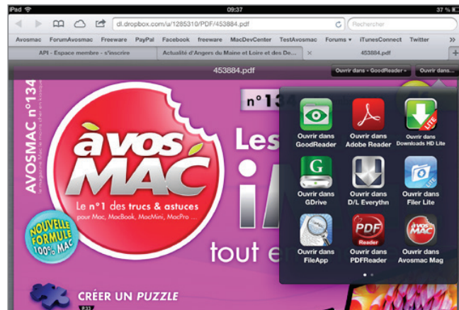
■ Un PDF ouvert dans Safari pourra être importé dans Avosmac pour iPad.

L A rédaction d'Avosmac permet aux lecteurs de lire Avosmac sur support papier (abonnement et kiosques), en version numérique au format PDF sur tablettes et ordinateurs quel que soit le système d'exploitation (abonnement ou commande à l'unité) et dans une version propriétaire sur iPad via l'application Avosmac pour iPad.