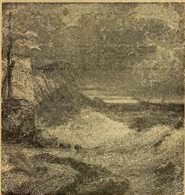
דאס שיפל דער הייטערט זיך צום אפגענעם ים

חולה זיין, אז ער האט געפינען זיין הויז פארשלאסן, האט אים שוין אנגעהויבן צו קלאפן דאס הארץ, גלייך האט דער אלטער רב געמאכט אזא רעש אין שטעטל אז אלע יהודים האבן זיך געמוזט נעמען אים זוכן. וואכן לאנג האט נעבעך דער אלטער רב געוויינט אן אויפהער, מיין פריינד! מיין גוטער חבר! וואס די שענסטע טעג אין מיין לעבן זענען געווען די טעג וואס איך האב מיט דיר צוזאמען געלערנט, ווו ביזטו פארשוונדן גע-