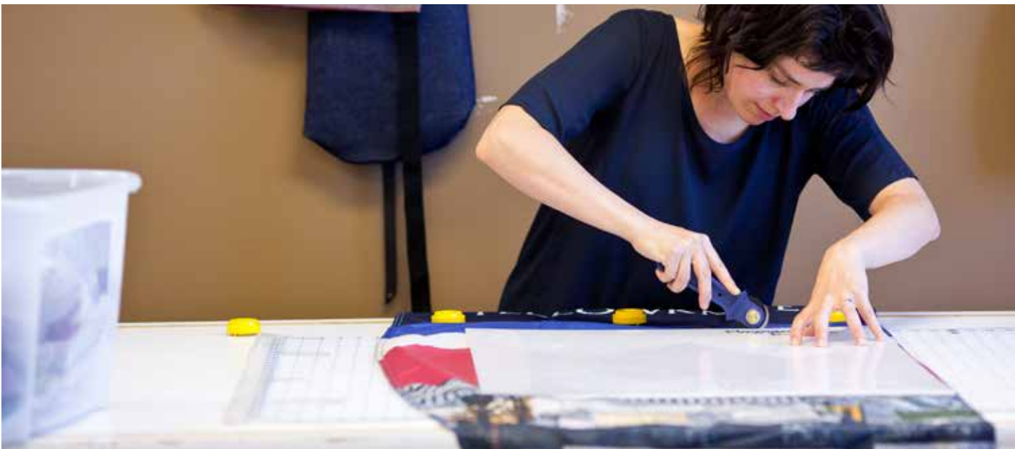
The Flagbarer team at work. L'équipe Flagbarer au travail.