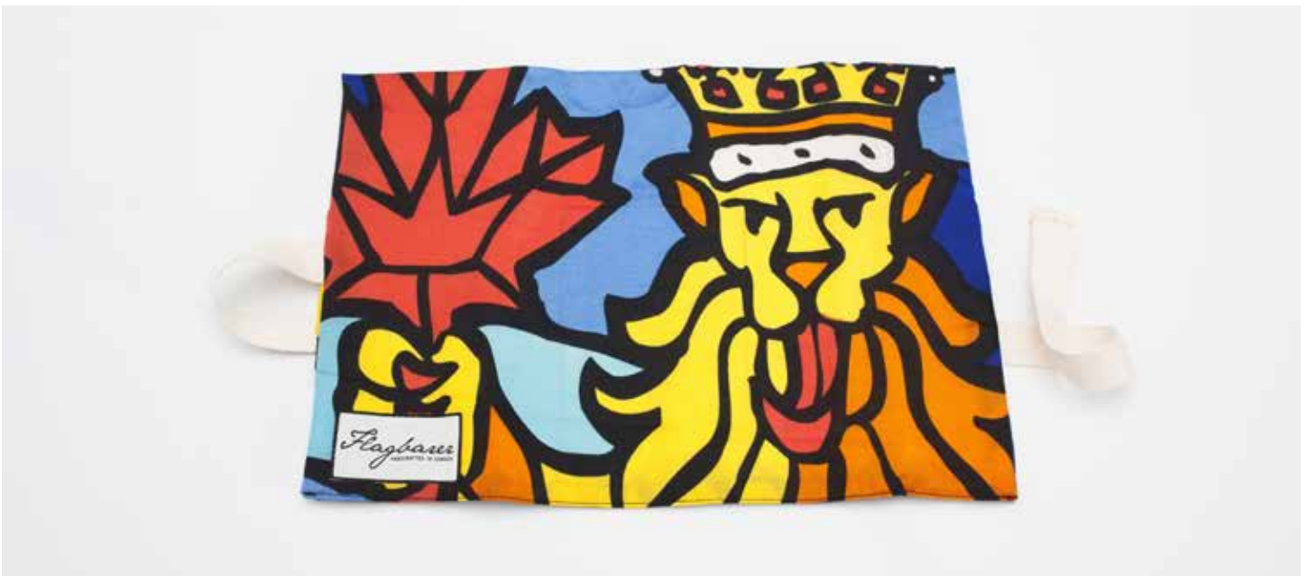
The various flags used by Flagbarer to create goods. Les divers drapeaux utilisés par Flagbarer pour créer des produits.