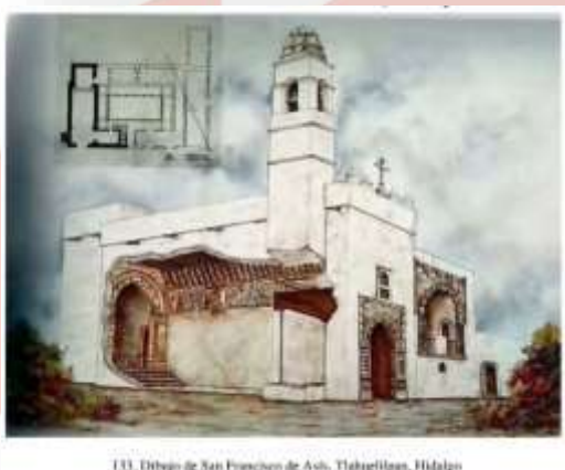
133. Dibujo de San Francisco de Asís, Tlahuelilpan, Hidalgo

Esta capilla está cubierta, al igual que la iglesia, con un alfarje de un solo orden de vigas. El acceso a la capilla es a través de una escalera de piedra en escuadra, que desemboca en planta baja, al pasillo del convento.