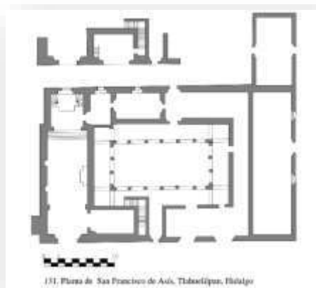
131. Planta de San Francisco de Asís, Tlahuelilpan, Hidalgo