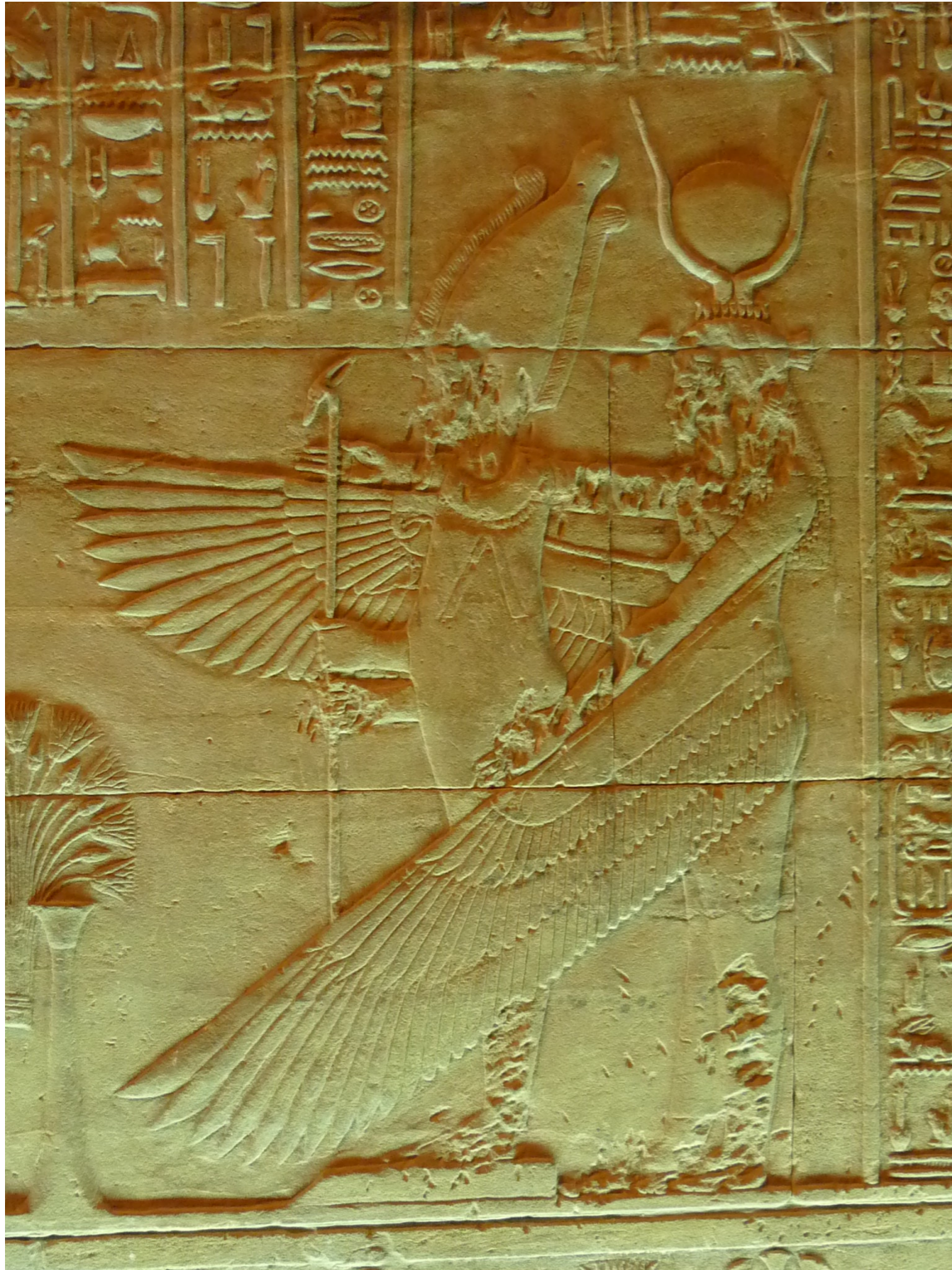
- Osiris e Isis en el Templo de Philae Egipto -

"Nosotros sabemos que la diosa Isis es la madre de todas las cosas, que las lleva a todas en su seno, y que sólo ella es la dispensadora de la Revelación y de la Iniciación. Profanos, que tenéis ojos para no ver y oídos para no oír, ¿a quién dirigiríais, si no, vuestras plegarias? ¿Ignoráis que sólo puede llegarse hasta Jesús por la intercesión de su Madre; sancta Maria [Isis] ora pro nobis?" (Fulcanelli).