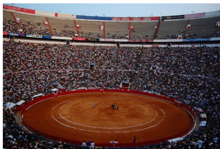
La Monumental Plaza de Toros de México

Las corridas de toros también son muy seguidas sobre todo en el centro del país donde se encuentra la plaza de toros más grande del mundo, La Monumental Plaza de Toros de México (Plaza México). Tiene una capacidad para más de 40.000 personas.