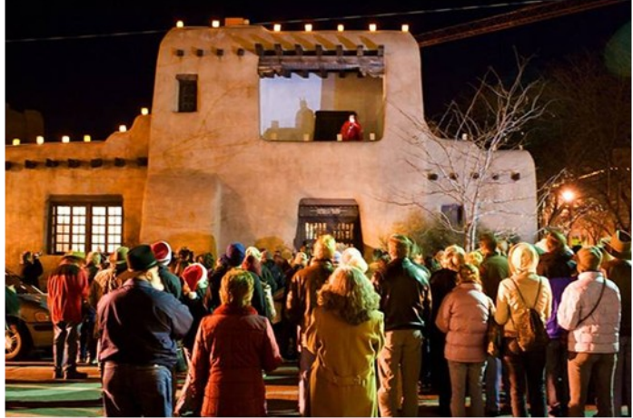
También se celebra en las calles

“Posadas” son fiestas religiosas pero también sociales – una representación festiva del viaje a Belén. La gente forma una procesión y cada uno lleva una candela y canta. Apenas lleguen a una casa, la mitad del grupo se queda afuera y pide hospedaje al otro grupo que entró a la casa. Las