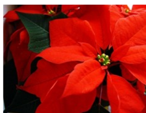
La flor Nochebuena se conoce hasta en Alemania

En México se celebra Navidad tradicionalmente. La primera señal para Navidad son las flores llamadas “Nochebuena”. Éstas adornan jardines, parques, calles, tiendas y casas.