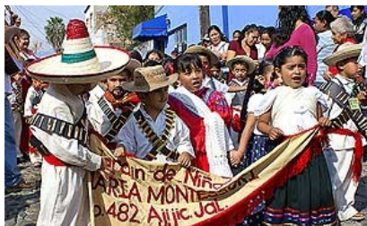
Niños mexicanos con ropa tradicional

Los mexicanos tienen muchas fiestas y celebran todo el año. Algunos son regionales, otros nacionales. Estos días muchos mexicanos bailan y cantan, comen y tienen puesto ropa tradicional . En México festivales muchas veces tienen un fondo religioso o tienen su origen en sucesos históricos .