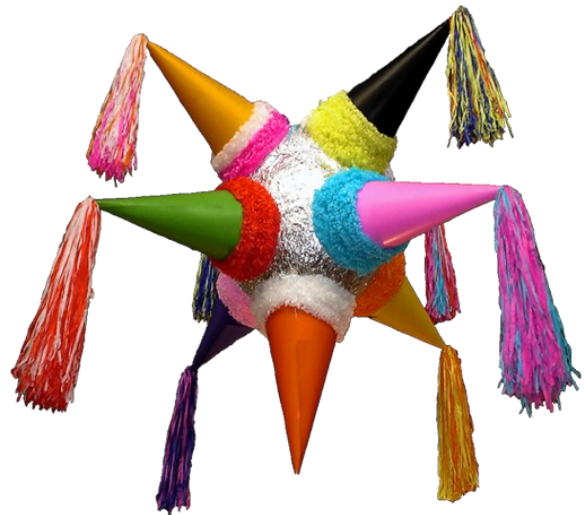
Seguro que en esta piñata se esconden muchos dulces

Al final de cada “Posada” se rompe la piñata. Las piñatas originalmente eran jarras de arcilla cubiertas de cartón piedra . Hoy en día solo son hechas de cartón piedra. Se infla un globo, se pega el cartón piedra al globo y se espera hasta que todo se endurezca. Luego se pincha el globo. Éste queda hueco para rellenarlo. Tradicionalmente la piñata, rellena de frutas temporales, tiene la forma de una estrella para representar la estrella que guio los Reyes Magos a Belén.