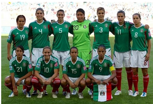
La selección mexicana femenil en la Copa Mundial 2011 en Alemania

En junio y julio 2011 la selección mexicana femenil participó en la Copa Mundial de la FIFA que ese año tuvo lugar en Alemania. Antes, México se había calificado con un triunfo sobre los Estados Unidos . Lamentablemente México fue eliminado en la eliminatoria después de una derrota contra Japón y dos empates contra Inglaterra y Nueva Zelanda.