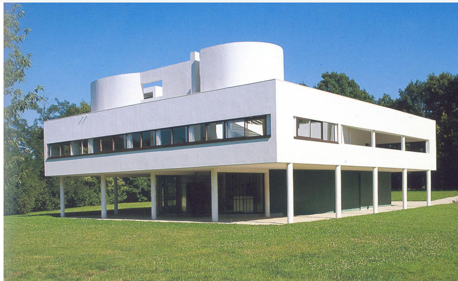
Le Corbusier - Villa Savoye (Poisy, Francia)

Sobre el origen se puede decir que el minimalismo es una versión corregida y extremada del racionalismo y de la abstracción con que las artes responden a la aparición revolucionaria de la industria a finales del s. XIX. En este momento, el arte y la arquitectura modernos adoptaron la máquina como modelo de obra autosuficiente reducida a su pura esencia y en pos de una autonomía.