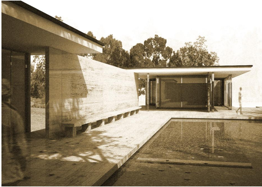
Mies van Der Rohe - Pabellón de Barcelona (Barcelona, España)