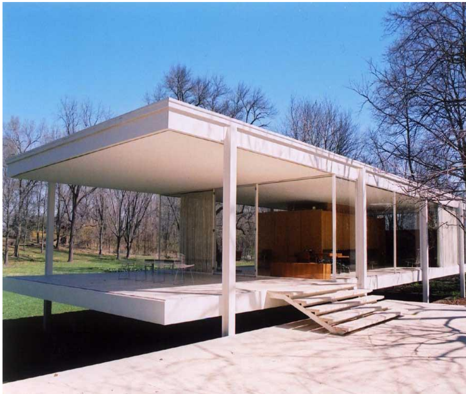
Mies Van Der Rohe - Frannsworth House (Illinois, USA)