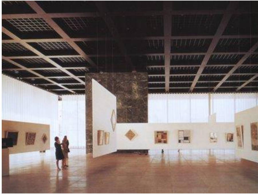
Mies Van Der Rohe - National Gallery (Berlín, Alemania)

Por otro lado, en 1925 el arquitecto franco-suizo, Le Corbusier llamaba a superar los antiguos lenguajes y a trascender las aportaciones del cubismo mediante el purismo. "Los nuevos tiempos exigen un espíritu de exactitud, un espíritu nuevo", argumentaba. En el clima de estas declaraciones publicó un ensayo con el título "El arte decorativo de hoy". En este artículo Le Corbusier pretendía señalar la contradicción de los términos: decoración y modernidad. Además cita en este ensayo como precedente la tesis de 1908 de Adolf Loos que relaciona ornamento con delito. Todas las ideas de Le Corbusier quedan plasmadas en los diseños y en las viviendas que desarrolla en estos años.