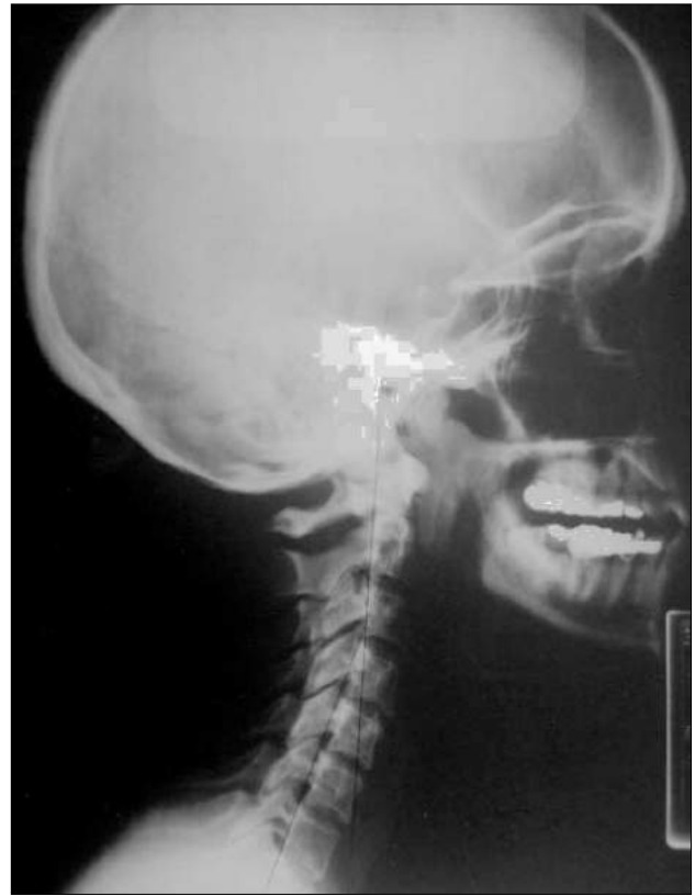
Figura 3. Radiografía lateral cervical tras el tratamiento (30 días más tarde).

mientos cervicales y de los puntos gatillo en el trapecio y el esternocleidomastoideo izquierdos y el músculo pterigoideo externo. El examen radiológico cervical lateral reveló unas vértebras cervicales rectas con ausencia de lordosis (fig. 2).