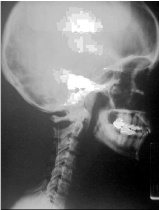
Figura 2. Radiografía lateral cervical antes del tratamiento.