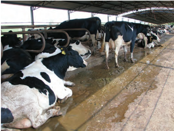
VACAS DEITADAS NOS CORREDORES DO FREE-STALL SÃO INDÍCIOS DE PROBLEMAS