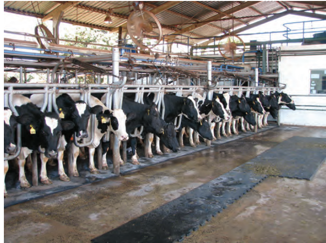
SALA DE ORDENHA COM PARTE DO PISO COBERTA POR TAPETE DE BORRACHA

Os tapetes de borracha podem ser fixados apenas nos locais de maior risco de escorregões e quedas, bem como em outras áreas onde as vacas passam muito tempo, como a sala de ordenha. Estes reduzem a abrasão e a pressão nos cascos, oferecendo mais conforto para as vacas. Por outro lado, os tapetes de borracha aumentam os custos com as instalações e exigem maior manutenção, quando comparados aos pisos de concreto.