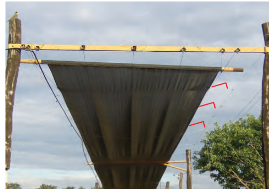
TELA DE SOMBREAMENTO ADEQUADAMENTE FIXADA