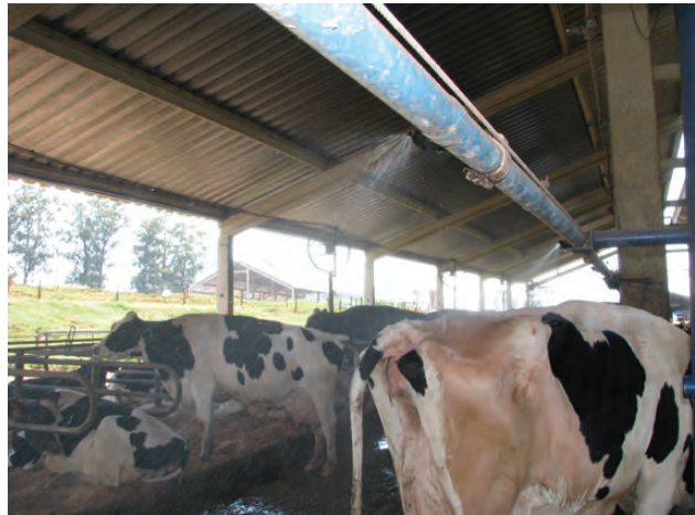
ASPERSOR PARA VACAS MANTIDAS EM FREE-STALL

Aspersão: neste sistema são liberadas gotas maiores, que umedecem o corpo do animal (figura ao lado), a perda de calor ocorre pelo processo de evaporação da água que está sobre o corpo do animal. Este tipo de sistema é mais eficiente quando combinado com o uso da ventilação forçada para acelerar o processo de evaporação. Há ainda sistemas que adotam a aspersão de água no telhado das salas de espera e de ordenha, reduzindo a temperatura do ar dentro destes ambientes.