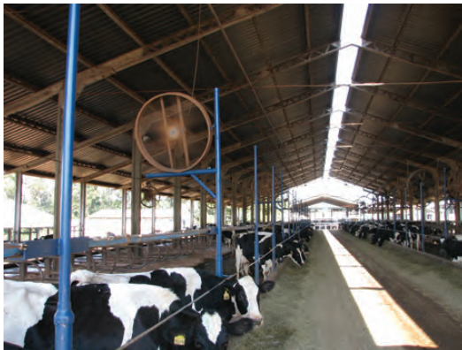
GALPÃO COM PRESENÇA DE LANTERNIM

Ventilação natural: Utilize de forma eficiente a ventilação natural do ambiente, tendo em conta os ventos predominantes no planejamento da instalação. Salas de ordenha e galpões devem ter o pé direito alto (pelo menos 3 m nas laterais) e lanternins (que são aberturas na cumeeira, que é a parte mais alta do telhado, como exemplificado na figura abaixo e à esquerda), que permitem a saída de ar quente localizado no cume do telhado do galpão. Escolha um local fresco da propriedade, que facilite a formação de corredores de vento, longe de barrancos ou encostas.