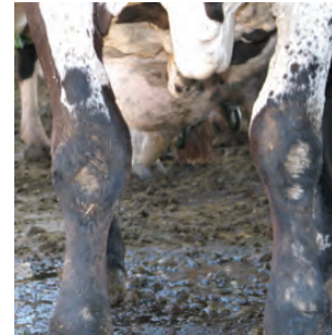
Escore 3. Ausência de pelo, edema e escoriações.