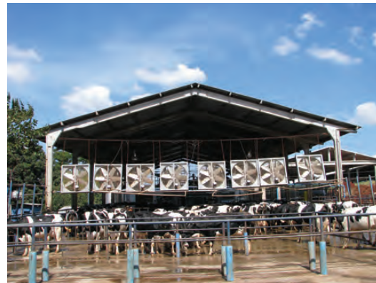
SALA DE ORDENHA COM PÉ DIREITO ALTO