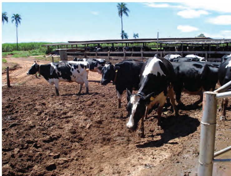
EVITE CAMINHOS COM PEDRAS E FORMAÇÃO DE LAMA, QUE DIFICULTAM A PASSAGEM DOS ANIMAIS