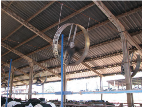
SISTEMA DE VENTILAÇÃO NO FREE-STALL

Ventilação artificial: É feita com uso de ventiladores instalados em locais estratégicos das salas de espera, de ordenha e nos estábulos. Para que a ventilação seja eficiente, não ocupe completamente todo o local, trabalhe de forma que pelo menos metade da área da sala de espera fique livre, assim a circulação do ar será mais eficiente e também facilitará a movimentação dos animais.