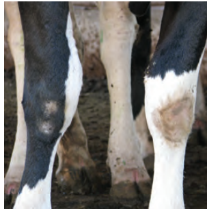
Escore 2. Ausência de pelos.