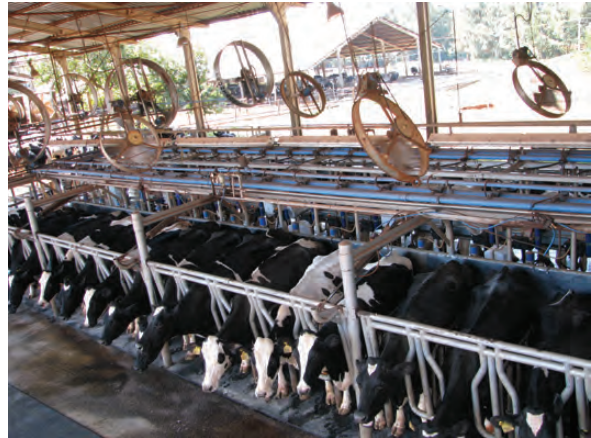
SALA DE ORDENHA COM SISTEMA DE VENTILAÇÃO