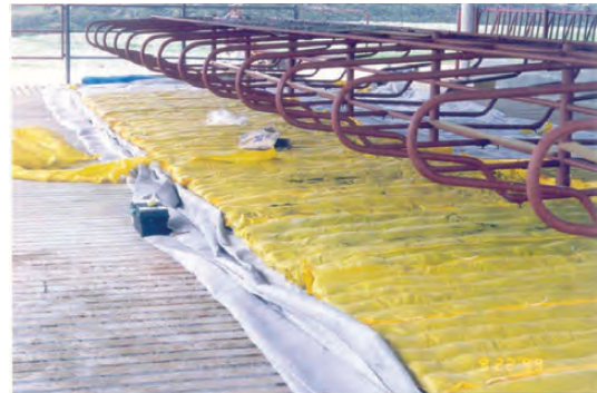
COLCHÕES SENDO COLOCADOS NO FREE-STALL. POSTERIORMENTE SERÃO REVESTIDOS COM LONA