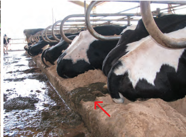
O IDEAL É QUE AS FEZES CAIAM NO CORREDORES E NÃO SOBRE A CAMA

3. Material da cama: As vacas preferem deitar em superfícies macias e frescas. Todos os tipos de cama possuem algumas vantagens e desvantagens, sendo que alguns são mais desejáveis que outros pelos benefícios à saúde e ao bem-estar animal. Pensando no conforto da vaca a pior situação é a ausência de cama, com os animais deitando diretamente no concreto, que é duro e abrasivo, o que causa lesões e calos nas articulações dos joelhos. Nunca deixe de disponibilizar material de cama para todas as vacas alojadas e em quantidade suficiente, com altura média de 10 a 15 cm.