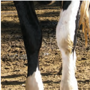
Escore 1. Sem alterações.

Monitore o conforto das vacas em lactação utilizando o escore de lesões apresentado nas figuras abaixo: