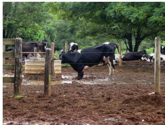
A FORMAÇÃO DE LAMA, COMUM DURANTE A ESTAÇÃO CHUVOSA, COLOCA EM RISCO O CONFORTO DAS VACAS ALOJADAS EM PIQUETES