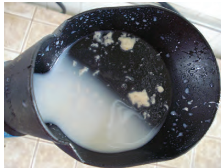
LEITE DE VACA COM MASTITE APRESENTANDO GRUMOS

Para maiores informações sobre o diagnóstico da mastite consulte o "Manual de Boas Práticas de Manejo – Ordenha", disponível em www.grupoetco.org.br .