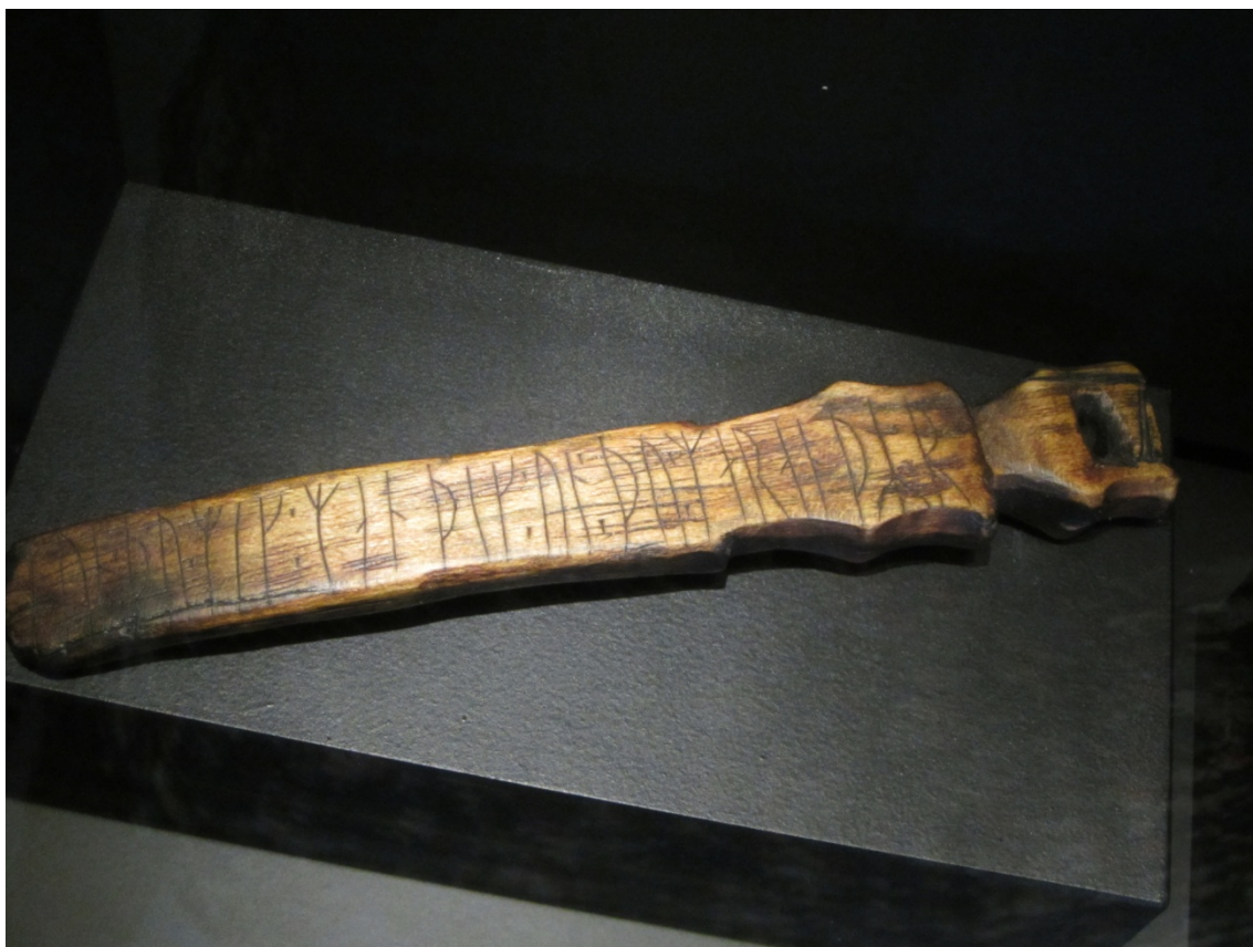
Cuchillo para tejer que lleva impreso un poema amoroso con signos rúnicos. Gamla Lödöse (Suecia). (Museu Marítim de Barcelona: Exposició Vikings)

Y aunque, era en su mayoría una escritura de carácter epitáfico, cuyos grabados en piedras homenajeaban a los héroes, jefes de tribu caídos en batalla. Además del aspecto religioso, estos monumentos podía erigirse en conmemoración de algún hecho importante para la comunidad, sobre el suelo en forma de pedestal situándose de manera destacada en los caminos, puentes,