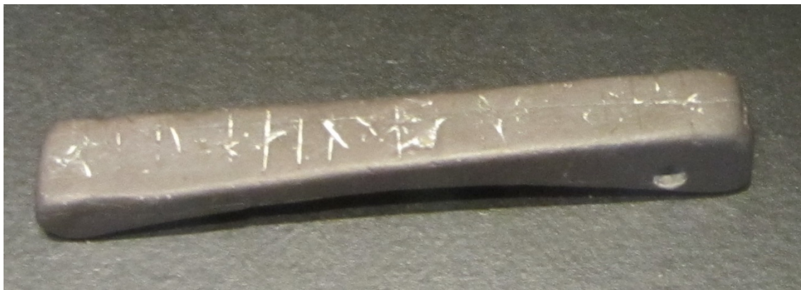
Piedra de afilar colgante en pizarra con caracteres rúnicos. Öland (Suecia). (Museu Marítim de Barcelona: Exposició Viking)