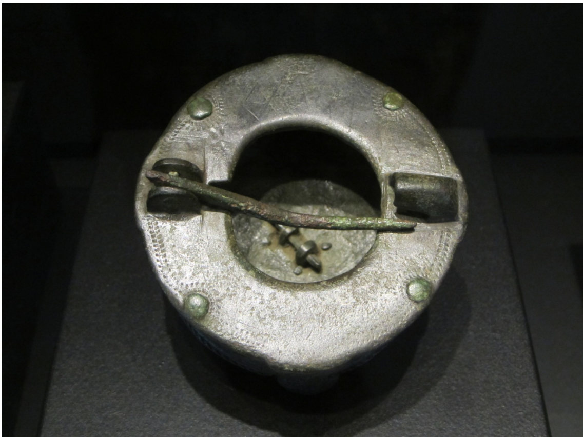
Un broche de bronce en forma de caja con inscripciones rúnicas. Gotland (Suecia). (Museu Marítim de Barcelona: Exposició Vikings)