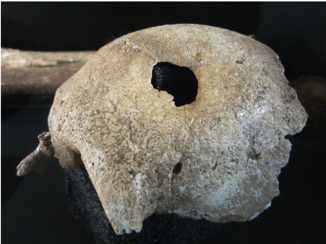
Cráneo de varón adulto trepanado. Gotland (Suecia). (Museu Marítim de Barcelona: Exposició Vikings)