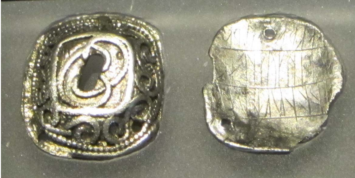
En el reverso de este colgante de plata encontrado en un yacimiento funerario en Suecia, se encuentran grabadas 4 líneas de escritura rúnica. (Museu Marítim de Barcelona: Exposició Vikings)