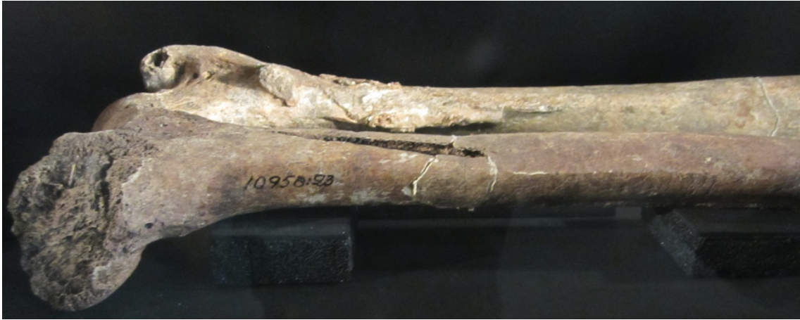
Fémur de varón adulto donde se aprecia un corte de espada en la parte inferior del fémur derecho. Gotland (Suecia). (Museu Marítim de Barcelona: Exposició Vikings)

Feroces guerreros sometidos a unas duras condiciones de vida. La antropología física estima su esperanza de vida en torno a los 45 años en los hombres, y 25-35 años entre sus compañeras; y una alimentación deficiente (anemia). En los yacimientos funerarios se observan esqueletos con fracturas y cortes que indican ataques violentos. Y también trepanaciones.