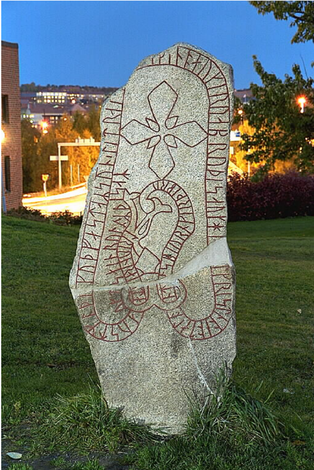
Piedra de Jämtland (Suecia) en la que está escrito que Austmaðr, hijo de Guðfastr erigió esta piedra, y el puente, y cristianizó Jämtland. La cruz se hace presente como signo del cristianismo. (Verbs in the Runes of Sweden).