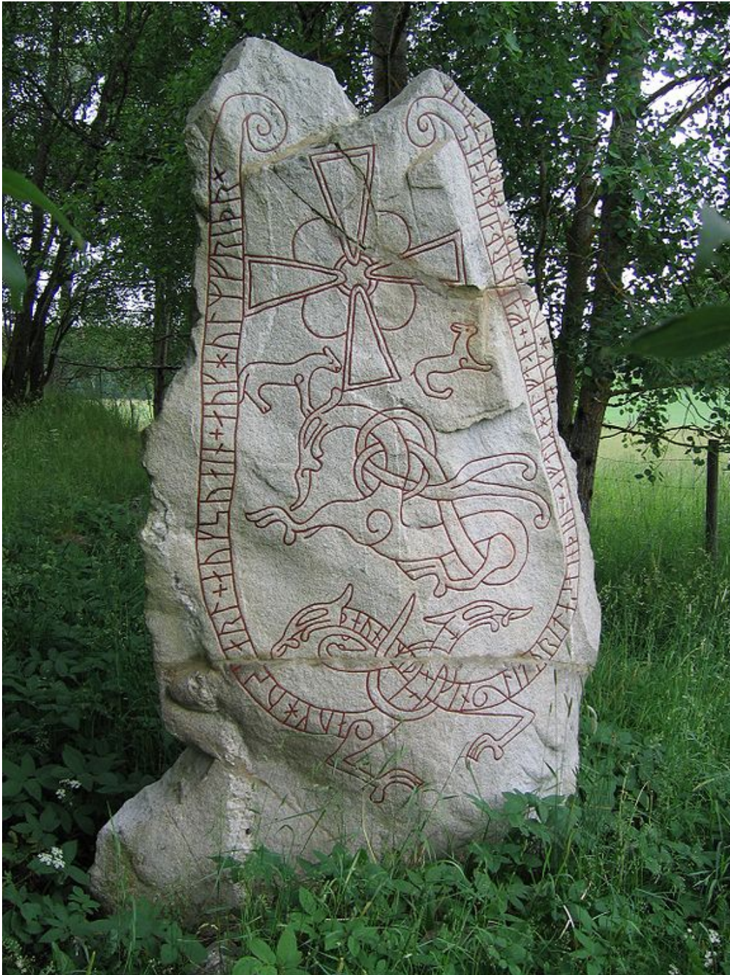
Runestone U 240, Vallentuna (Bérig). En torno al “Lindworm”, motivo que significa serpiente o dragón entrelazada se disponían los signos rúnicos. Se pintaban con vivos colores ( rojo, negro, blanco y azul).

líneas fronterizas, etc... También había lugar para la literatura y poética, transcribiendo cantos y leyendas antiguas o frases de amor, e incluso se han descubierto piezas con función civil más prosaica, como la piedra que recoge las leyes de Scania (Suecia).