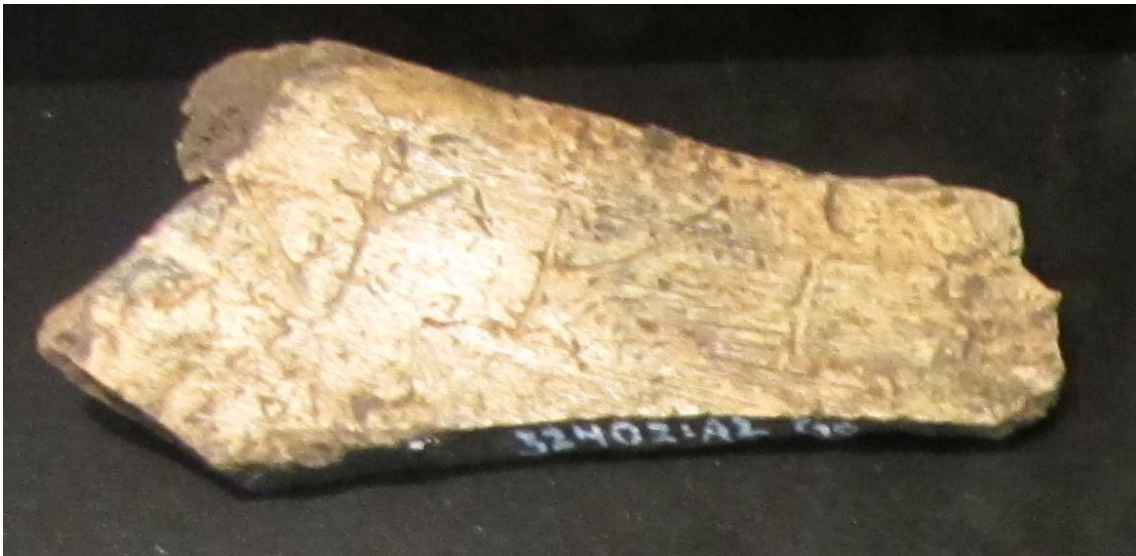
Hueso con inscripción rúnica. Gotland (Suecia). (Museu Marítim de Barcelona: Exposició Vikings)

Era una escritura epigráfica, por lo que las runas se inscribían en piedra, o sobre cualquier otro material duradero como hueso, metal o madera; grabándose sobre objetos diversos, tales como amuletos (láminas), peines, joyas (broches, fibulas, medallas, hebillas), monedas, cofres, cajas (urnas de cremación), armas (puntas de lanza, cuchillos, espadas), herramientas, etc.