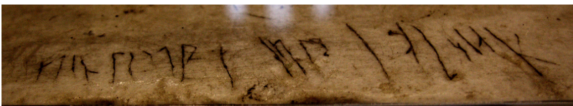
Graffiti rúnico en Santa Sofía (Hagia Sophia) data del s. IX. Sólo es legible el nombre de Halvdan.