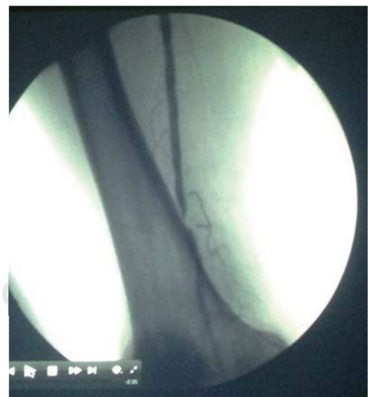
Figura 4. Arteriografía de la femoral superficial, mostrando oclusión de un cm en su tercio inferior.