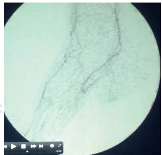
Figura 7. Arteriografía de la arteria dorsal del pie, mostrando su pobre visibilidad.