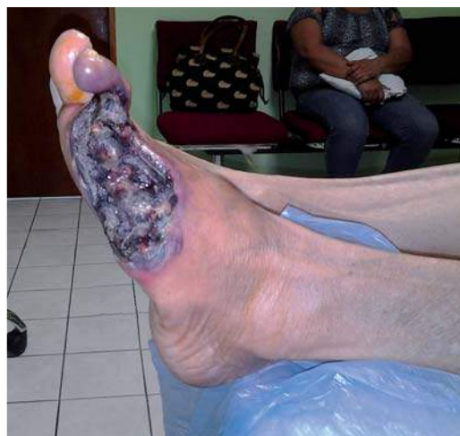
Figura 3. Características clínicas del pie izquierdo tratado previamente con ozonoterapia.

Espectro Doppler arterial evidencian-do enfermedad femoropoplítea en la extremidad izquierda.