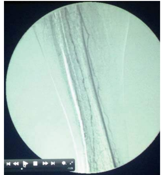
Figura 6. Arteriografía de vasos tibiales, mostrando estenosis multisegmentaria en el tercio medio e inferior.