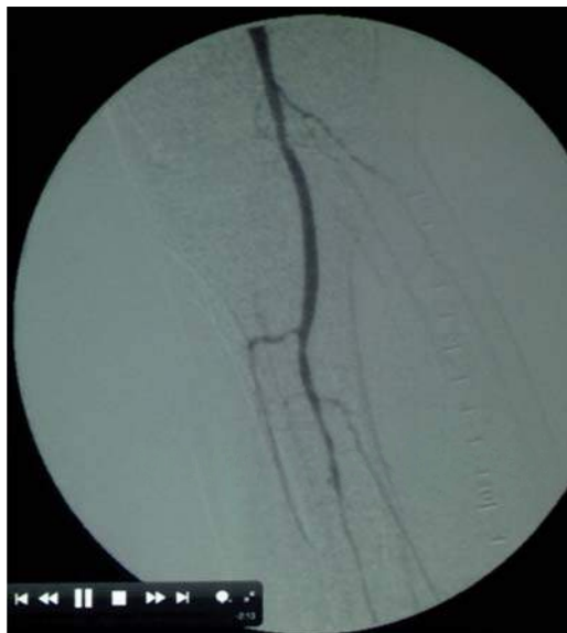
Figura 5. Arteriografía de vasos tibiales, mostrando la oclusión y estenosis multisegmentaria en su tercio superior.

que se expone es representativo de la inadecuada investigación clínica del sujeto, el empleo inapropiado de la terapia con ozono y la subestimación de la lesión. De acuerdo con los antecedentes clínicos de la paciente, la ubican con factores de riesgo (edad mayor de 60 años, prevalencia de EAP de más de 20%, presencia de diabetes mellitus de más de 10 años de