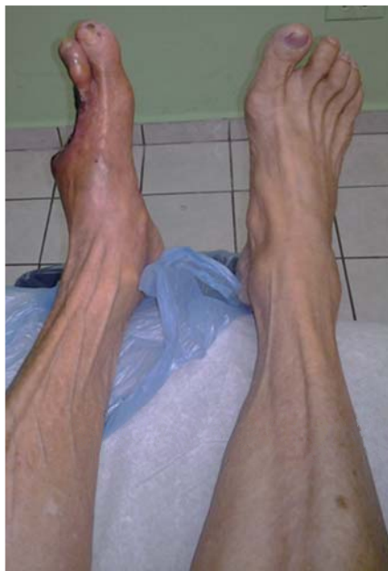
Figura 1. Comparación de extremidad inferior con lesión e íntegra.

después de recibir ozonoterapia, se le realizó resección del tercer y cuarto dedo por extensión del proceso inflamatorio y necrosis. Después del tratamiento quirúrgico, le continuaron con el de ozono. La paciente acudió a este centro por considerar que no obtenía la mejoría ofrecida, notando un deterioro progresivo de su pie y su herida quirúrgica, así como la presencia de náuseas, vómitos, malestar general y sensación de debilidad. En el examen físico se encontró a la mujer pálida, con sensación de ortopnea, polipnéica y con facies de dolor. Los signos vitales fueron: frecuencia cardíaca (FC) 103 latidos por minuto, frecuencia respiratoria (FR) 20 respiraciones por minuto, temperatura 37.5 °C, tensión arterial (TA) 202/103 mmHg. En la exploración oftalmológica destacó la disminución de la agudeza visual y datos de retinopatía. Cuello, sin soplos ni ingurgitación yugular. Tórax, campos pulmonares sin estertores ni sibilancias, ruidos cardíacos arrítmicos, sin ruidos agregados. Abdomen, sin soplos. El miembro pélvico derecho presentó pulso femoral, poplíteo y pedio; sin alteraciones de importancia ( Figura 1 ). El miembro pélvico izquierdo presentó pulso femoral palpable, pulso poplíteo y pedio ausentes, lo cual fue corroborado por el estudio de Doppler