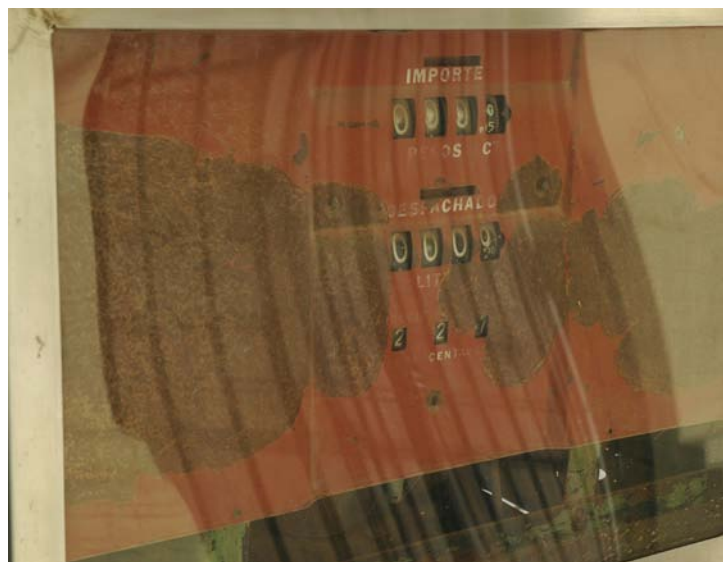
© Valeria Schwarz, de la serie Urribelarrea , 2005.

Algunos microorganismos establecen una simbiosis mutualista con otros organismos, mediante la cual el microorganismo ofrece un beneficio a su huésped a cambio de recibir otro. Los hongos micorrícicos establecen este tipo de simbiosis con las raíces de las plantas formando lo que se conoce como micorriza. En esta simbiosis, la planta suministra al hongo fuentes de carbono procedentes de la fotosíntesis (proceso que el hongo no