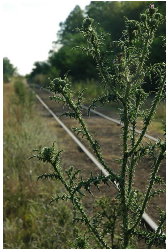
© Valeria Schwarz, de la serie Urribelarrea, 2005.

En México, la Comisión Nacional para el Conocimiento y Uso de la Biodiversidad (CONABIO), desde su creación en 1992, consideró en sus temas de desarrollo inventariar la diversidad microbiana. 16, 17 Sin embargo, aunque a la fecha no existe suficiente información en el Sistema Nacional de Información sobre Biodiversidad (SNIB), recientemente se están generando los mecanismos para recabar esta información mediante el Subsistema Nacional de Recursos Genéticos Microbianos (SUBNARGEM). Este Subsistema tiene como objetivos actualizar y sistematizar la informa-