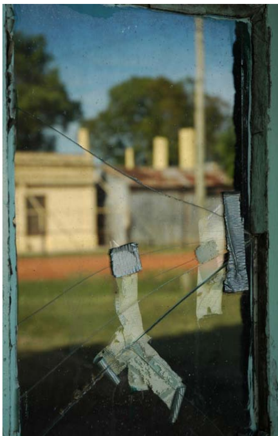
© Valeria Schwarz, de la serie Urribelarrea , 2005.