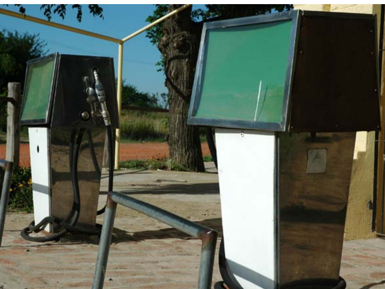
© Valeria Schwarz, de la serie Urribelarrea , 2005.

que algo de las bacterias muertas con cápside transformó a las sin cápside en virulentas. Este fenómeno, hoy conocido como transformación genética bacteriana (introducción de ADN extraño a una célula), fue esencial para identificar al ADN como el responsable de que la virulencia de las bacterias muertas fuera transferida a las no virulentas vivas y de que esta se heredara de una generación a otra. Esto revela la utilidad de los microorganismos en diversos hallazgos que marcaron importantes avances científicos. Así, el trabajo de Griffith fue crucial para el posterior descubrimiento del ADN y de su estructura, y estableció la base para el surgimiento de la genética molecular que posteriormente permitió eventos como el desciframiento del genoma humano o la obtención de plantas transgénicas con el uso de Agrobacterium tumefaciens , una bacteria que se encuentra en casi todos los suelos del mundo.