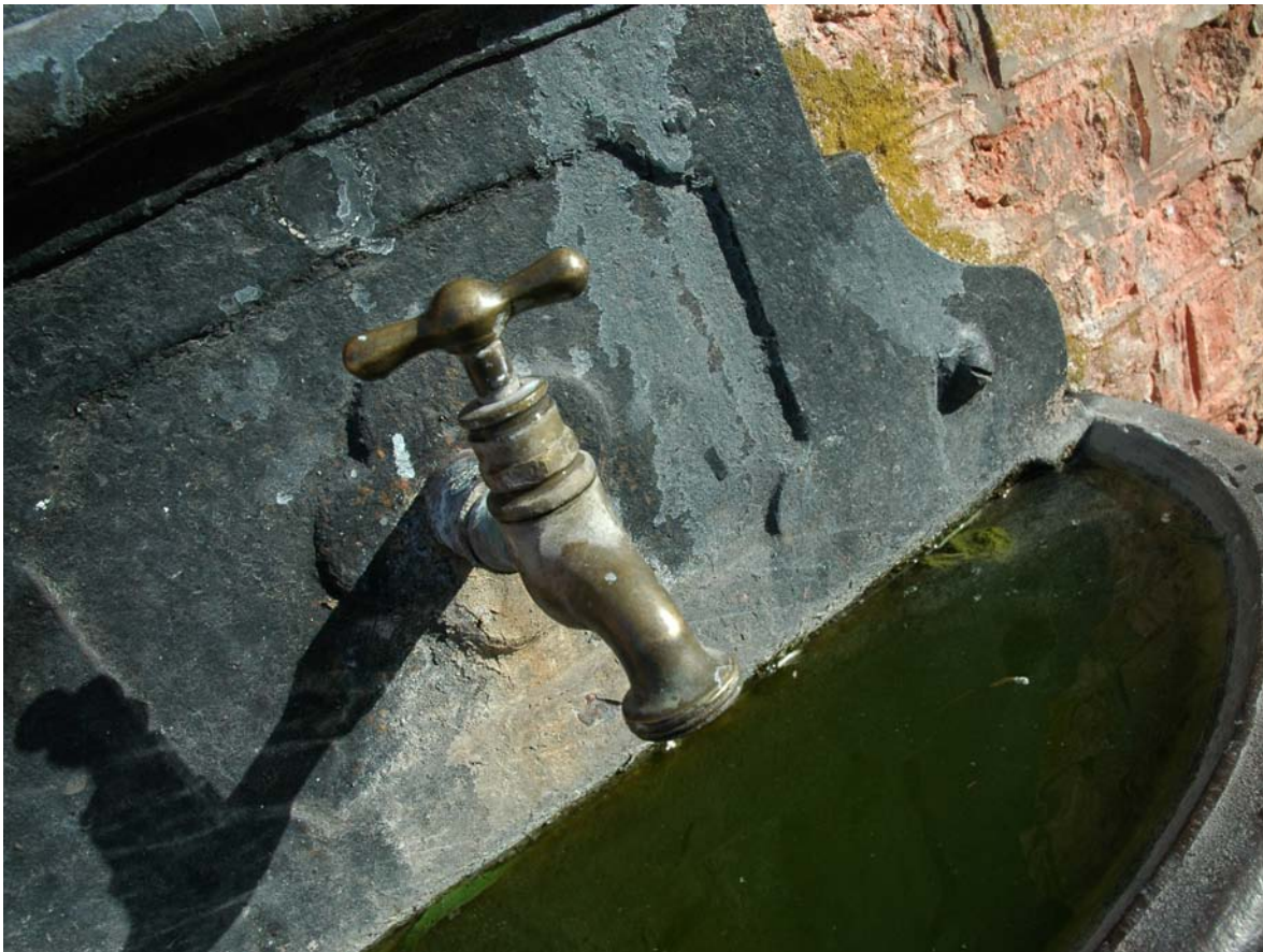
© Valeria Schwarz, de la serie Urribelarrea , 2005.

4 Paul EA. Soil microbiology, ecology, and biochemistry , Academic Press (2007).