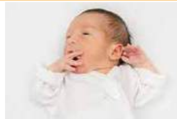
Insiste en chupetear su mano