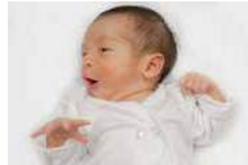
Gira la cabeza buscando el pecho