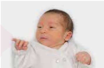
Mueve brazos y piernas, trata de chupetear sus manos