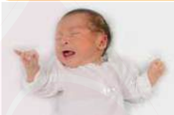
Agita brazos y piernas, se queja