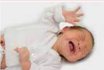
Se pone rojo y aumenta la intensidad de su llanto