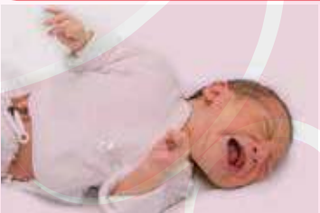
Llora y agita todo su cuerpo sin parar