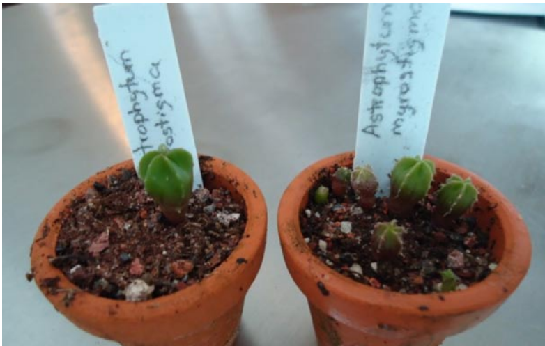
Astrophytum myriostigma a 6 meses de germinación