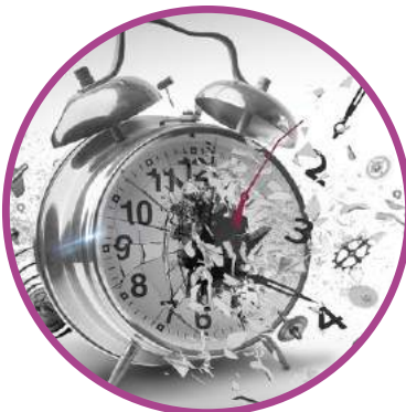
Sin horarios, cada vez que el bebé lo pida.

El bebé llora porque tiene hambre, la leche materna es insuficiente.