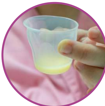
Calostro= Oro líquido

El calostro es la leche con MAYOR CANTIDAD DE NUTRIENTES . Es normal que tarde en salir y que sea poca la cantidad.