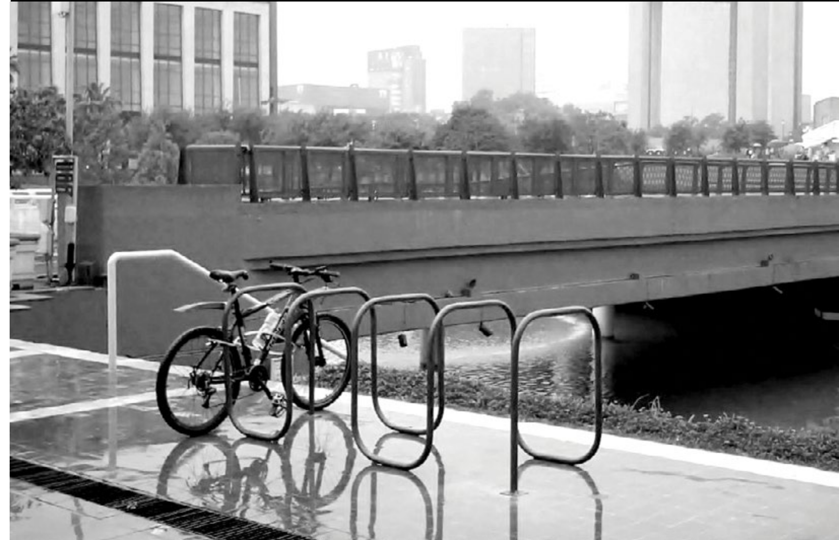
Biciestacionamiento Museo de Historia Mexicana Mty

Guía para la Promoción de Espacios Biciamigables de la BICIREDMX: http://www.bicired.org/guia-biciamigable/