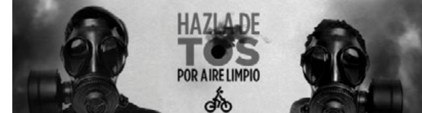
Banners: Tormenta de Twitts y #CharlaConBicired

Y ayúdanos a difundir la página, Hazla de Tos