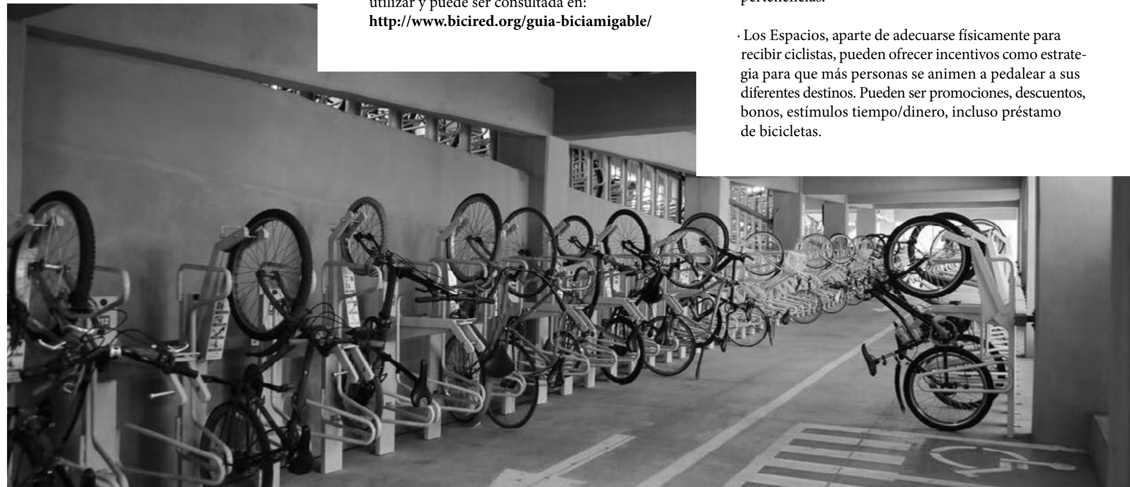
Foto : Biciestacionamiento CETRAM La Raza CDMX

· Los Espacios, aparte de adecuarse físicamente para recibir ciclistas, pueden ofrecer incentivos como estrategia para que más personas se animen a pedalear a sus diferentes destinos. Pueden ser promociones, descuentos, bonos, estímulos tiempo/dinero, incluso préstamo de bicicletas.