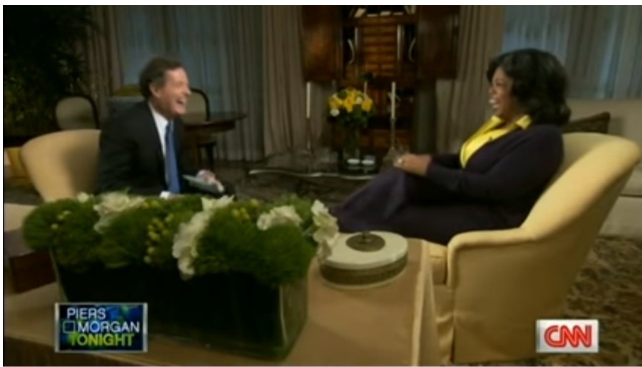
INTIMATE INTERVIEW with Oprah Winfrey · Piers.Morgan.Tonight

https://www.youtube.com/watch?v=2ptBBNIZXtl - Oprah é entrevistada por Piers Morgan em 2011 (em inglês).