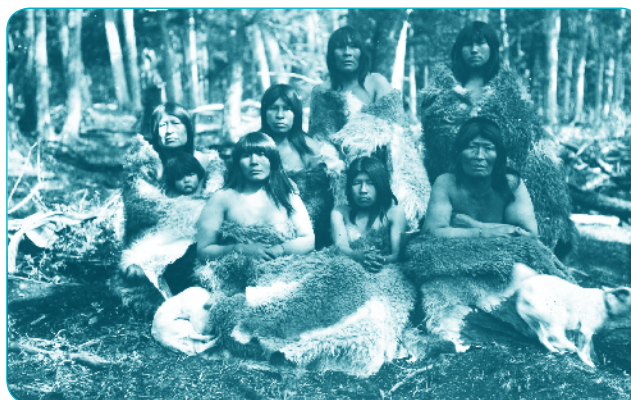
Grupo de mujeres Selknam (Onas) en el Lago Fagnano. Tierra del Fuego. Verano 1919