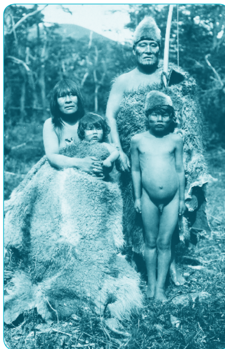
Familia Selknam (Ona) Tomada por Martín Gusinde en el Lago Fagnano. Tierra del Fuego. Verano 1919

Estos pueblos fueron exterminados hasta su completa extinción por los europeos que colonizaron la zona en el siglo XIX.