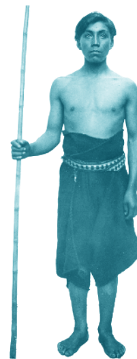
Joven mapuche. Año 1920. MHN