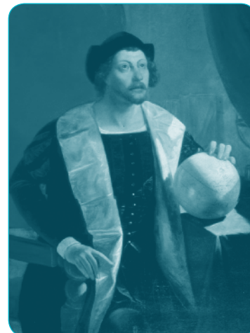
Retrato de Cristóbal Colón. Alejandro Cicarelli. 1849. MHN

Magallanes y Sebastián Elcano en 1520 descubren el Estrecho (de Magallanes) que comunica el Océano Atlántico con el Pacífico. Es la primera ocasión en que los europeos avistan “territorio chileno”.