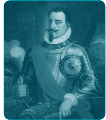
Retrato de Pedro de Valdivia. Pedro León Carmona. MHN

Encontró la muerte después de ser tomado prisionero en Tucapel el 25 de diciembre de 1553, hecho que dio inicio a la primera gran sublevación mapuche, la que al mando del toqui Lautaro amenazó con desterrar el dominio español de estas tierras.