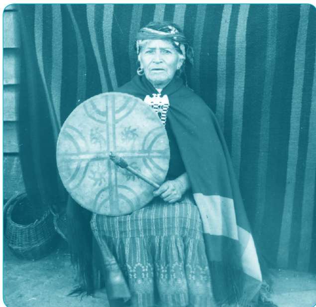
Machi con kultrún. MHN

Cada familia estaba agrupada en lov o clanes que tenían un antepasado común. No existía un gobierno central y los jefes militares o toquis perdían su poder una vez finalizada la guerra.