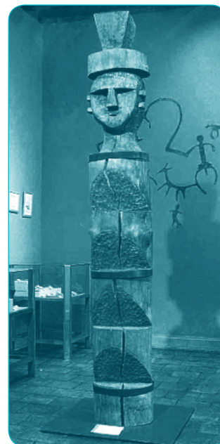
Rewe (Réplica) MHN

Huilliche o gente del sur. Pueblo que habitaba en la zona al sur de los mapuche, entre el río Toltén y hasta el archipiélago de Chiloé. Menos numerosos que los mapuches.