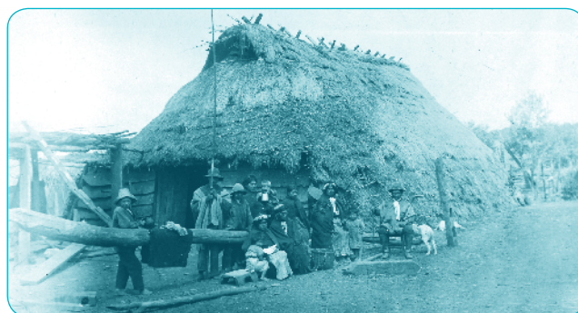
Ruca (Vivienda) Mapuche fotografía 1940