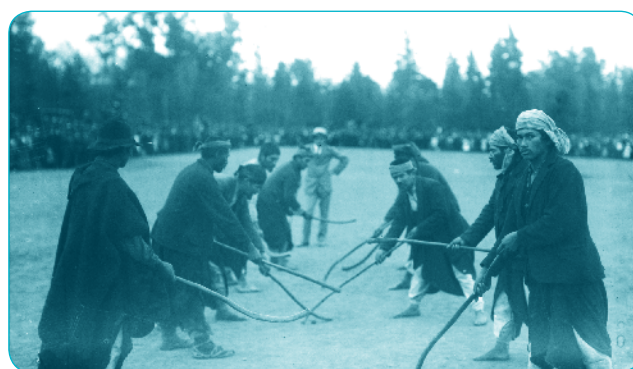
Juego del Palín, colección MHN

Elaboraron una hermosa cerámica con dibujos geométricos de colores blanco, rojo y negro con formas inspiradas en hombres y aves.