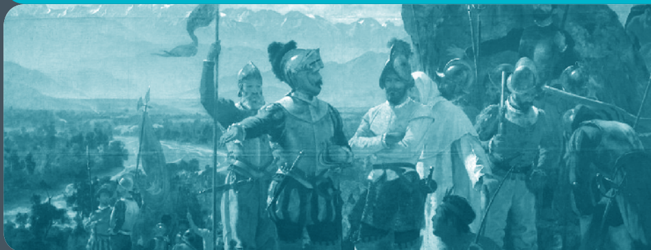
"La Fundación de Santiago" Pedro Lira Museo Histórico Nacional. MHN.