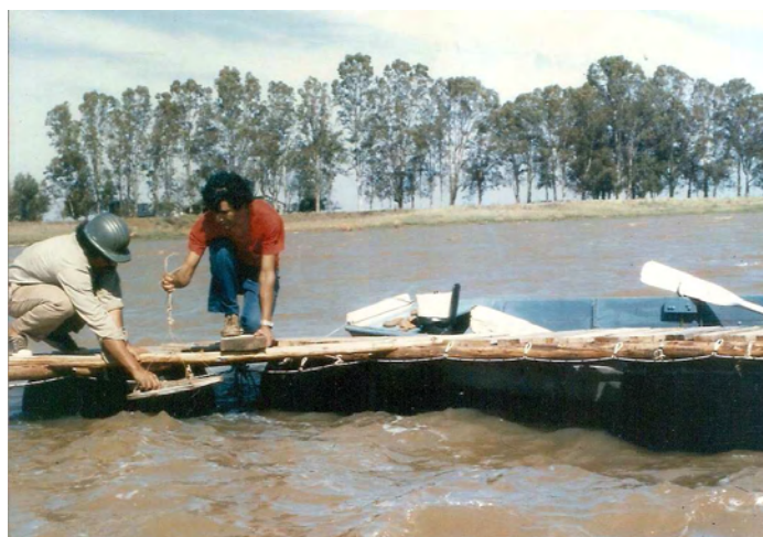
Figura 1: Jaulas flotantes para cultivo de pejerrey