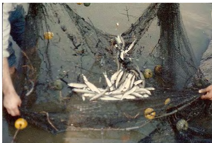
Figura 2: Pejerreyes obtenidos de cultivo