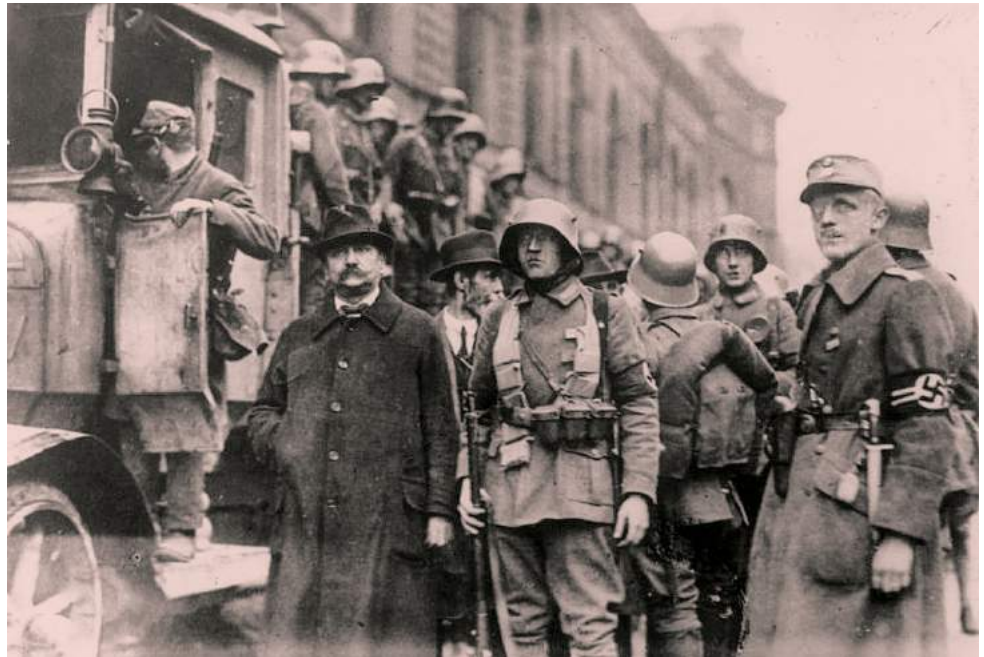
Patrullas prohitlerianas llevan a cabo redadas para detener a consejeros municipales socialistas. Estas redadas eran un esfuerzo para tomar el poder durante el golpe de estado de la cervecería de 1923 en Múnich.

En un artículo de la época, su autor expresaba con cierta ironía que algunos oficiales alemanes dejaban de figurar en las listas del ejército y al cabo de algunos años reaparecían con el distintivo de piloto aviador, y encuentra una respuesta a su duda al expresar: «¿Dónde han estado durante el tiempo de su eclipse?, habían estado en Rusia en el Ejército Rojo. Por eso dejaron de ser militares, porque siéndolo, según el Tratado de Versalles, no pueden marchar a ningún ejército extranjero, pero un civil es dueño de ir a donde le parece, y si en el Ejército Rojo lo admiten y le enseñan el funcionamiento de la aviación, de los tanques, de la artillería pesada, el Gobierno de los Soviets sabrá por qué lo hace» 10 .