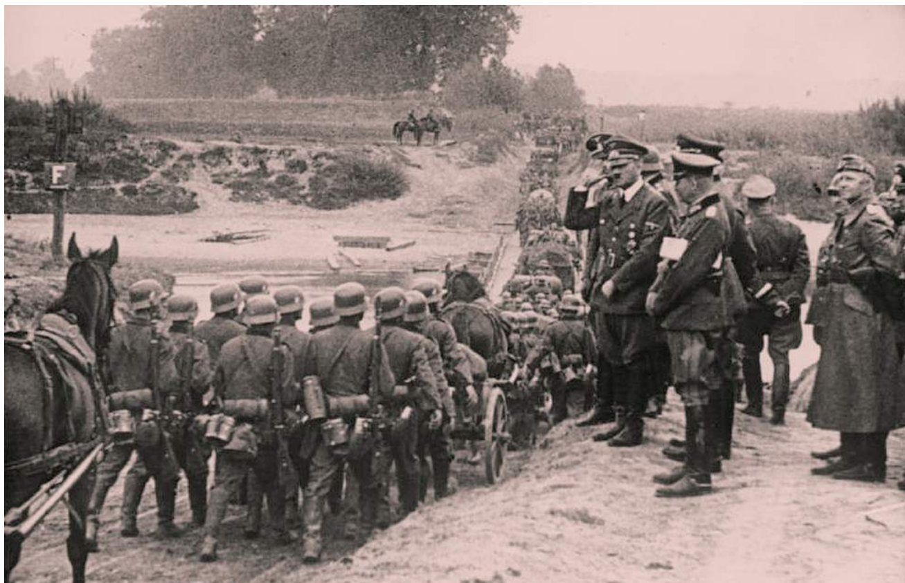
Tropas de la campaña alemana contra Polonia marchan frente a Adolf Hitler mientras él las saluda. La invasión de Polonia comenzó el 1 de septiembre de 1939.

aproximadamente 90 000 exilados que habían llegado huyendo del régimen nazi, y que el servicio de inteligencia interna (MI5) consideró que por haber caído en desgracia con el «aliado potencial» debían ser considerados sospechosos y vigilados, atribuyéndoseles la posibilidad de ser espías soviéticos por la única razón de su hostilidad al nazismo 25 .