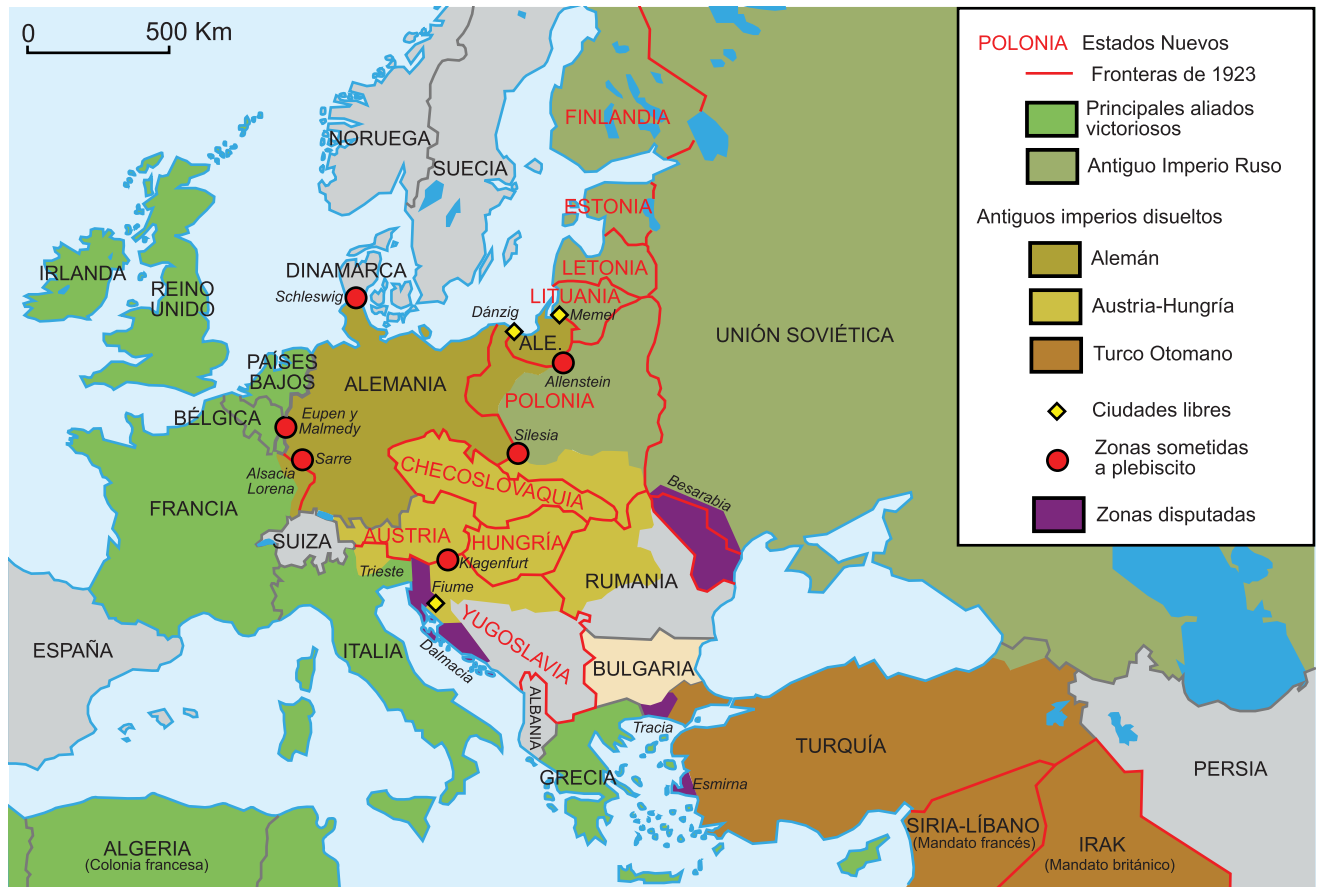
Un mapa con las fronteras posguerra en rojo sobre el mapa preguerra de Europa. Nota: este mapa no muestra el Estado Libre de Irlanda.

El complejo proceso de desmovilización y adecuación de las fuerzas militares del desaparecido Imperio Alemán a lo establecido por el Tratado, pasó por un periodo de conversión en la etapa de la nueva República de Weimar, que fue cumplida provisoriamente por el «Übergangsheer» (Ejército Transitorio). La finalización de la tarea de reestructuración se cumplió el 1 de enero de 1921 con la creación de las nuevas