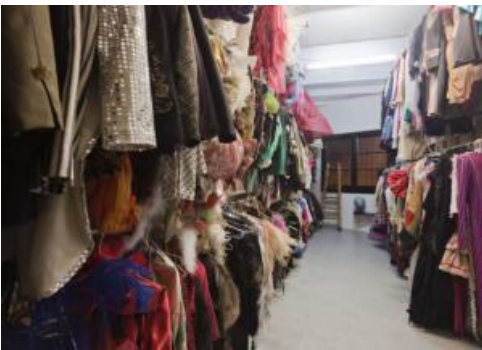
Ejemplo de vestuario para teatro

Los atuendo a usar en escena comúnmente no implican tanto problema, luego de haber propuesto el guion de la historia, la temática y su contexto social los mismos participantes con sus roles correspondientes van ubicando los atuendos que se necesitan, la ideas que vayan surgiendo se proponen con el grupo y en un dialogo general se tomará la decisión para aceptar la propuesta completa o sumar algún otro aspecto que se crea conveniente , si las historias presentadas serán expuestas con la literalidad de la realidad vivida los atuendos no serán difíciles de conseguir, pero en el caso de que lo representado sea desde una propuesta que contenga las características de un guion con fabulas, metáforas o aspectos ficticios, seguramente los atuendo serán a la medida de la historia lo que implicará su creación encargando este trabajo a un sastre, habrá las opciones de conseguir las bajo préstamo, usar prendas propias, o invertir en ellas para su creación.