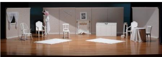
Ejemplo de escenografía de una obra

Cuando sea necesario presentar obras en lugares distintos con distancias significativas es recomendable que los materiales se pueden conseguir en ese mismo lugar para ahorrar la carga y los problemas que trae consigo mover varios objetos, será las cosas de importancia para la escena y que no se puedan conseguir en el lugar de escenificación que exigirán su traslado de un lugar a otro.