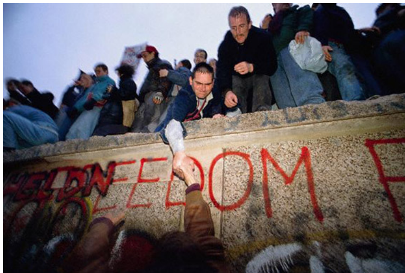
La caída del muro de Berlín fue uno de los acontecimientos más significativos de la Historia del siglo XX.

En los primeros días de octubre se celebró el 40 aniversario del régimen, con visita de Gorbachov, quien