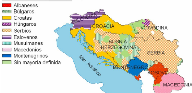
Las mayorías étnicas en la antigua Yugoslavia.

aferrados al poder, comprendieron que podrían enarbolar en vez de la desacreditada bandera del comunismo la nueva del nacionalismo para mantenerse. Fue lo que ocurrió al acceder en 1986 Slobodan Milošević a la dirección de la Liga de los Comunistas serbios. Los serbios suponían solo el 36% del censo global, pero