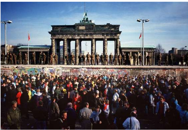
La caída del muro de Berlín el 9 de noviembre de 1989 es el símbolo de la desaparición de la Guerra Fría y de la evaporación del comunismo.

La oleada de revoluciones que en el otoño de 1989 produjo el derrumbamiento en cadena de los regímenes comunistas en los países del Este. Fue un proceso ante todo inesperado, que nadie podía vaticinar, y en muchos aspectos de gran originalidad, en cuanto que era un proceso sin antecedentes, aunque la casualidad haya querido que se desatara coincidiendo con el bicentenario de la Revolución Francesa. En lo que podríamos denominar el otoño de los pueblos , de la misma manera que en 1848 se habló de la primavera de los