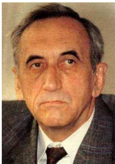
Tadeusz Mazowiecki, primer ministro no comunista de Polonia en décadas.

Jaruzelski en diciembre del año siguiente, con el objetivo de impedir una invasión soviética, Solidaridad mantuvo una actividad clandestina. Por añadidura, en Polonia posee una influencia decisiva la Iglesia Católica.