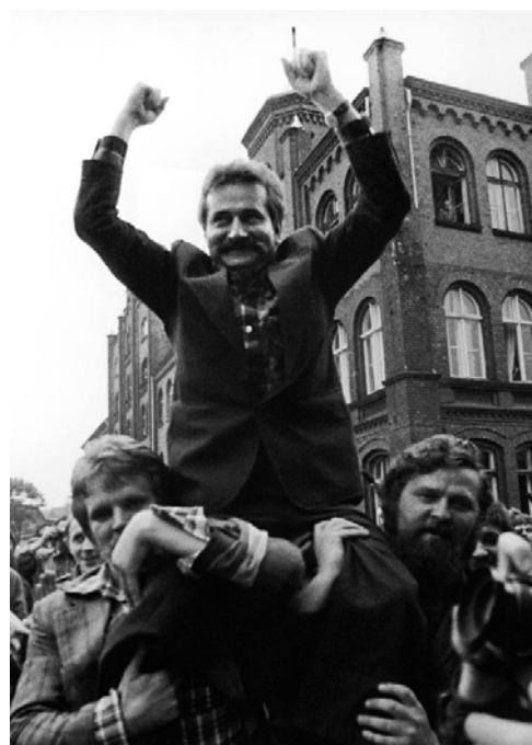
Walesa, presidente de Solidaridad y uno de los artífices de la caída del comunismo en Polonia.

El caso polaco se singulariza porque la revolución siguió el impulso adquirido tras la convocatoria de elecciones libres. En realidad era el único país del Este donde existía un movimiento social organizado capaz de ganar unas elecciones al comunismo en el poder. De la oleada huelguística de agosto de 1980 había nacido el sindicato Solidaridad , con su carismático líder Walesa al frente. A pesar de la declaración de la ley marcial por el presidente