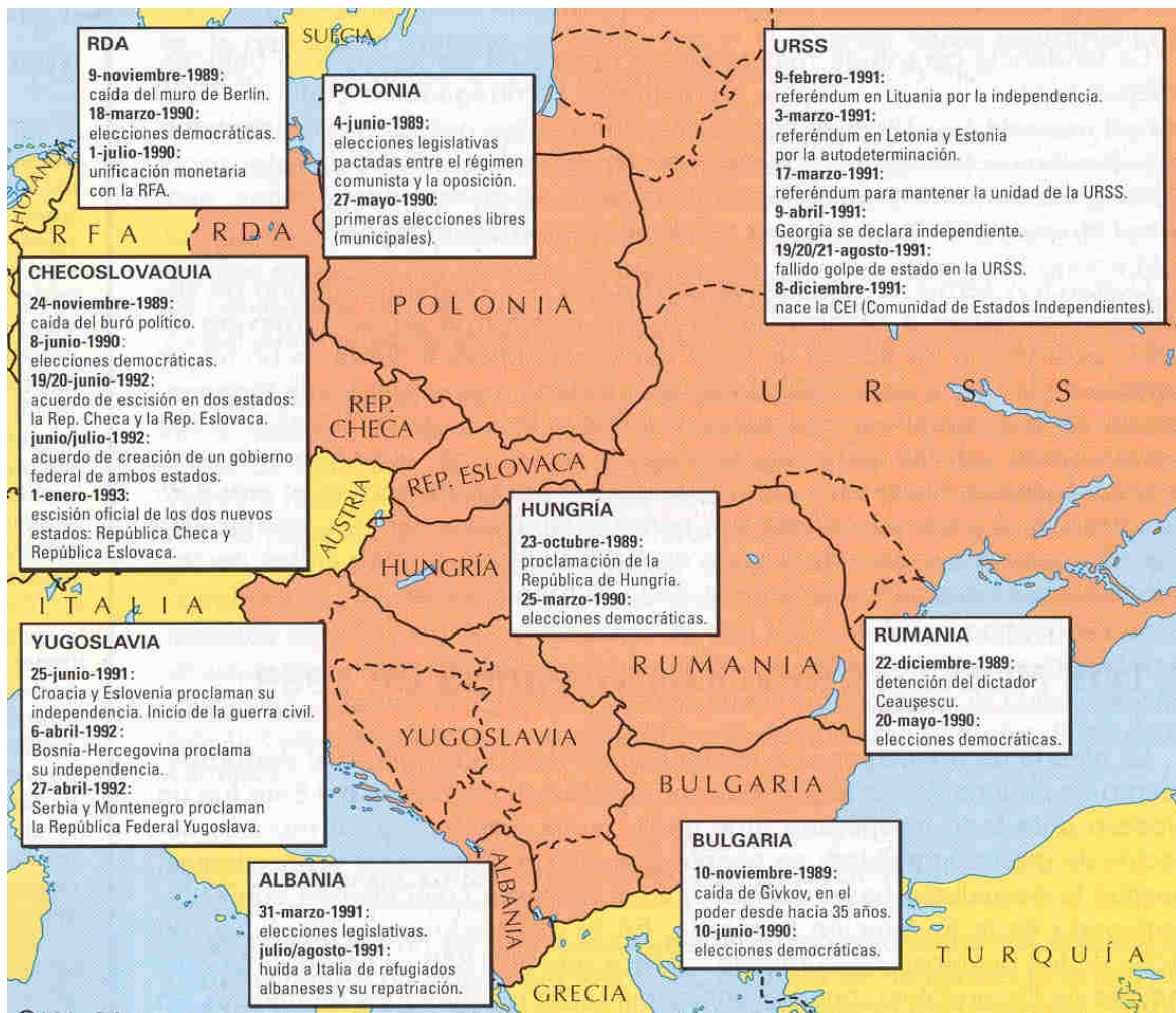
La caída del comunismo país por país, principales hitos.

pueblos , pueden analizarse tanto revoluciones de palacio, en una especie de harakiri que se atrevieron a iniciar algunos dirigentes, como movilizaciones populares. Su carácter pacífico fue la nota sorprendente. Porque todo se consiguió sin violencia. Revolución de terciopelo , se ha denominado al proceso de cambio político de Checoslovaquia, quizás el ejemplo más puro.