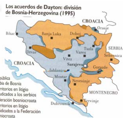
Bosnia: composición étnica antes de la guerra (1990) y acuerdos de Dayton (1995).

representaban el 83% de la población de Serbia, el 30% en Bosnia-Herzegovina y el 11,5% en Croacia. El dirigente serbio, Milosevic, afirmó que aceptaría la independencia de los otros estados de la federación yugoslava sobre la base de territorios étnicos, es decir, si se respetaba la posibilidad de que los enclaves serbios optaran por la integración en una Gran Serbia . Pero no respetó este principio en Kosovo, donde convivía un 90% población albanesa, perseguida cuando demandó autonomía, y un 10% serbia. Tras una campaña de exterminio por parte de Serbia y ataques terroristas del lado kosovar, fuerzas de la OTAN intervinieron en la provincia serbia y pusieron fin a los