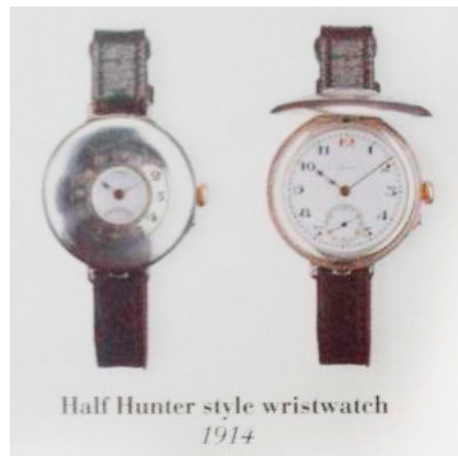
Figura 4. Relógio de pulso Half Hunter, de 1914

A popularização do relógio de pulso, contudo, só aconteceu de fato com a chegada da Primeira Guerra Mundial, em 1914, devido à necessidade dos soldados de marcar o tempo em ações militares. Clarke (1998, p. 6) diz que “Durante a 1ª Guerra Mundial, o relógio de pulso encontrou distinção entre os pilotos e oficiais da artilharia, o que ajudou a perder sua reputação afeminada” 6 . Com o fim da Guerra, o relógio se popularizou também entre os civis.