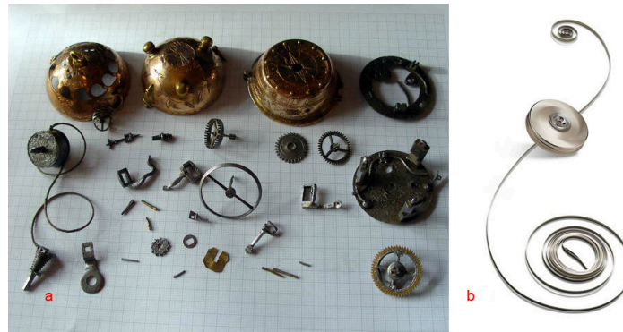
Figura 2. Espiral de Aço 2 .

Até então, se usava a cerda de porco como mola espiral para calibrar o ritmo e a precisão dos relógios, e a imprecisão destes dispositivos era comum. Foi apenas em 1675 que Christian Huygens inventou a espiral de aço (Figura 2b) para os relógios de bolso, substituindo estas cerdas e aumentando significativamente a precisão na marcação do tempo.