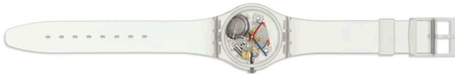
Figura 7. Relógio Swatch, de 1983

As décadas de 1970 e 1980 foram de inovação estética, introduzindo as pulseiras de plástico, as transparências e os relógios eletrônicos, fugindo do tradicionalismo encontrado até então e apresentando temas divertidos nos produtos, como arte de rua 13 . Eventualmente houve um retorno às origens dos mostradores analógicos, agora combinados à precisão da tecnologia de quartzo. Foi nessa atmosfera que surgiu a empresa Swatch TM , que lançou em 1983 o Swatch (Figura 7), um relógio que viraria clássico e acessível: com pulseira de plástico e apenas 51 componentes (ao invés dos mais de 125 utilizados até então) além de novos modelos lançados a cada seis meses 14 . A Swatch TM tirou a indústria relojoeira suíça da crise.