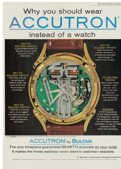
Figura 5. Anúncio da década de 1960 do Accutron , primeiro relógio completamente eletrônico

espaço no mercado. A inovação da empresa logo foi seguida pelas demais, gerando uma movimentação no comércio de relógios 10 . Ao redor do mundo surgiram diferentes centros de estudo de tecnologia voltados para os relógios 11 , desenvolvendo a tecnologia de cristal de quartzo para o relógio de pulso, novo grande avanço na área.