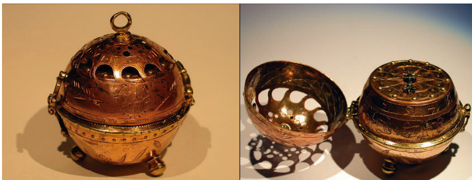
Figura 1. Relógio de Peter Henlein, conhecido como Ovo de Nuremberg

O primeiro relógio portátil é creditado ao alemão Peter Henlein, considerado hoje o pai da relojoaria moderna. O site History of Watches destaca que “A comunidade científica aceitou Peter Henlein, relojoeiro de Nuremberg, Alemanha, como o pai do relógio moderno e o originador de toda a indústria relojoeira como conhecemos hoje” 1 . O primeiro relógio portátil foi feito no início do século XVI (Figura 1) e, embora não fosse espetacularmente preciso ou pequeno, apresentava grande avanço em relação aos relógios utilizados até então.