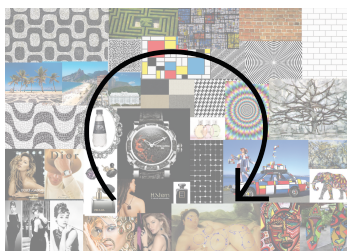
Esquema de leitura

Foi a partir da leitura do moodboard que o conceito do trabalho se fez claro. Observando o percurso de leitura da imagem, intuitivamente criamos uma história ao montar este quadro de inspiração, e foi essa história que procuramos abordar. A contraposição da imagem de uma mulher real ao lado da representação de ícones da moda se fez clara, e a inspiração para o trabalho também. Desta forma, a técnica se mostrou eficaz.