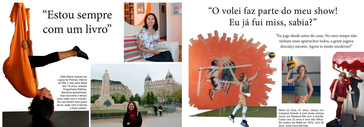
Figura 11. Exemplo de perfis Persona