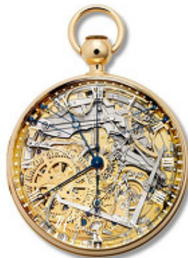
Figura 3. Relógio de Bréguet para a Rainha da França Maria Antonieta

O primeiro relógio de pulso foi feito pelo francês Abraham Louis Bréguet (1747–1823), por encomenda da princesa de Nápoles Carolina Murat, irmã de Napoleão Bonaparte 3 , em 1810. Bréguet foi um relojoeiro francês de grande maestria, e costumava criar relógios para a alta monarquia da época, incluindo, além da família Bonaparte, o rei da Inglaterra George IV, o czar Alexandre I e a própria rainha da França, Maria Antonieta. (Figura 3).