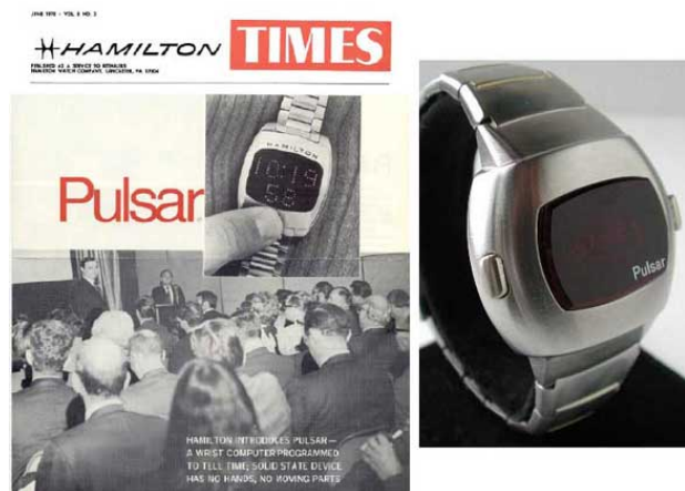
Figura 6. Anúncio de 1972 do Pulsar , primeiro relógio digital

Em 1969 o primeiro relógio movido a quartzo foi inventado pela empresa japonesa Seiko e, em 1972, surgiu o primeiro relógio digital de quartzo, o Pulsar (Figura 6) da marca Hamilton, com o LED substituindo a bateria e o LCD substituindo os ponteiros e o visor de cristal 12 .