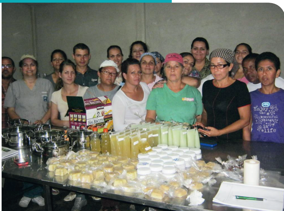
Grupo de mujeres de cuatro regiones del país, trabajando por el desarrollo social de Costa Rica.

Brinda la oportunidad de generar conocimiento en aquellas personas con deseo de superación, además de mejorar la economía familiar a mujeres emprendedoras que puedan implementarlo.