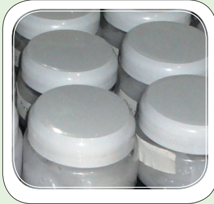
Cuadro 1 Ingredientes para elaborar crema

(Fuente: Arpeche L. 2012. Elaboración de Cremas, Campus, Geles y Jabones. San José, CR. Manual Didáctico, ARGUES. LTDA. p.1-16 ).