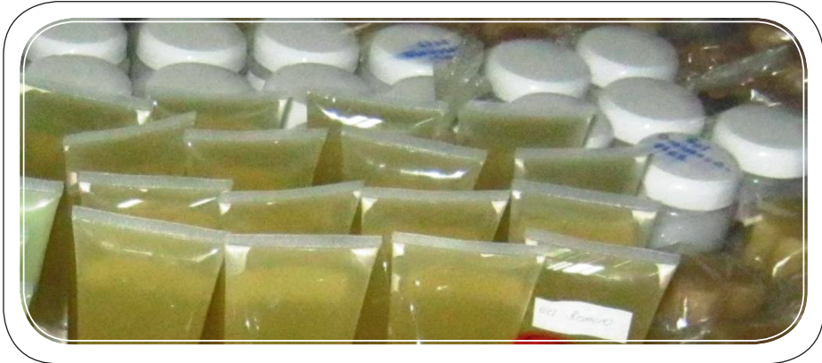
Cuadro 4 Ingredientes para elaborar ungüentos