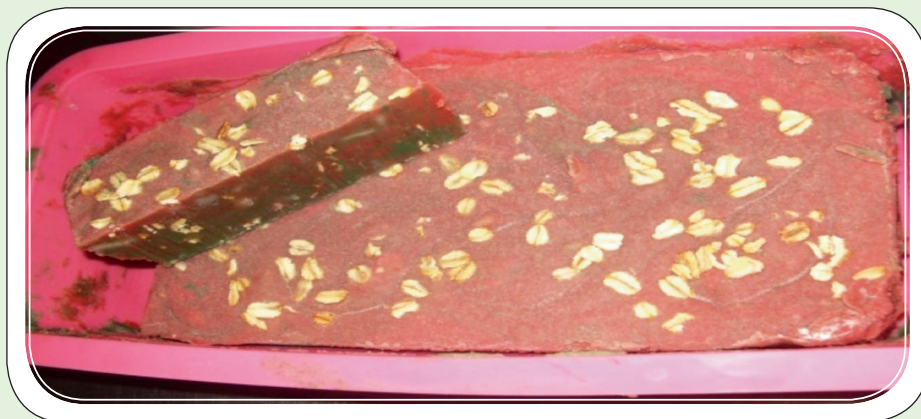
Cuadro 6. Ingredientes para elaboración de jabón