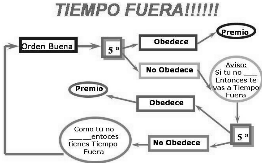
Figura 7. Diagrama del Tiempo Fuera