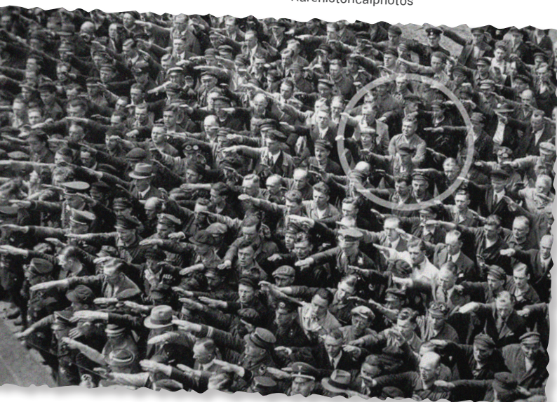
August Landmesser en la botadura de una nave de entrenamiento nazi, Alemania, 30 de junio de 1936