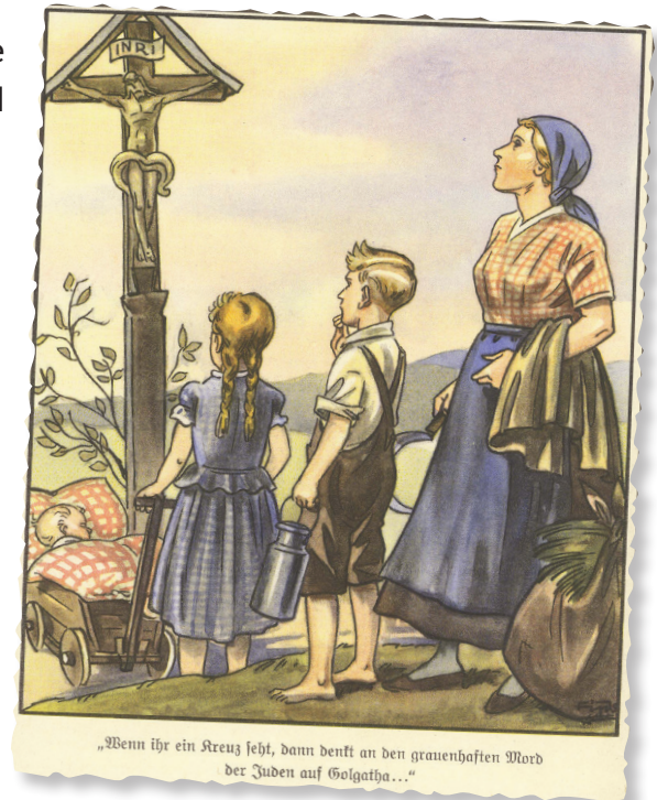
Dibujos de Fips [nombre artístico de Phillip Ruppert] Editorial Der Stürmer - Núremberg, 1938 Lo que Cristo decía sobre los judíos "Cuando miren la cruz, piensen entonces en el terrible asesinato cometido por los judíos en el Gólgota..." Archivo fotográfico de Yad Vashem - 1599/232

Es importante debatir con los alumnos sobre el significado del uso de motivos antisemitas que eran ya utilizados en la Edad Media.