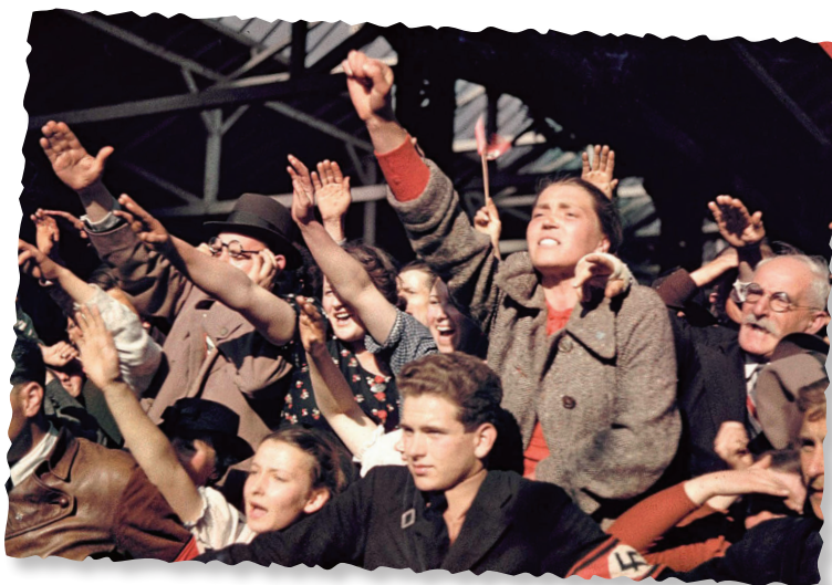
Multitud vitoreando a Hitler, Alemania, 1938