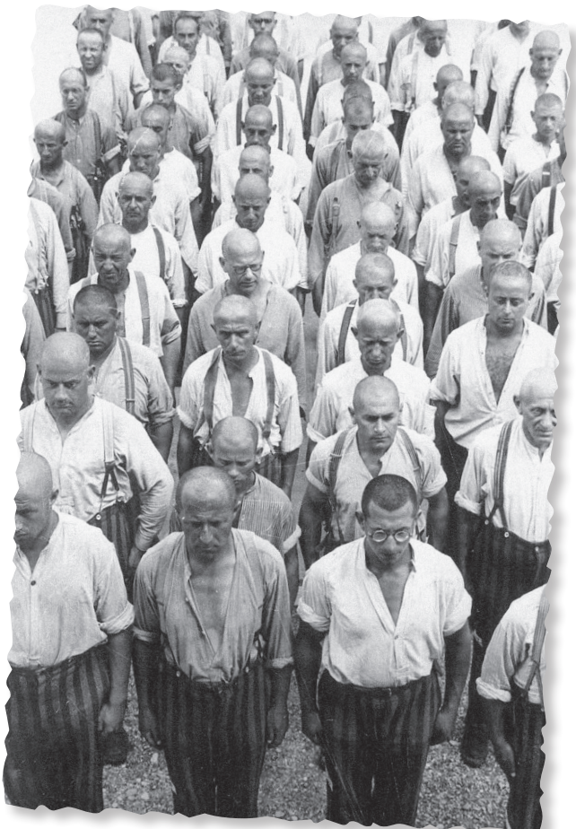
Prisioneros en el campo de concentración de Dachau, Alemania, 1938

4D09