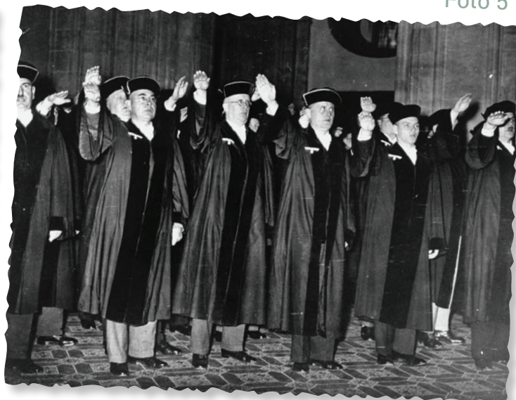
Jueces saludando a Hitler, Berlín, Alemania, 1 de octubre de 1936