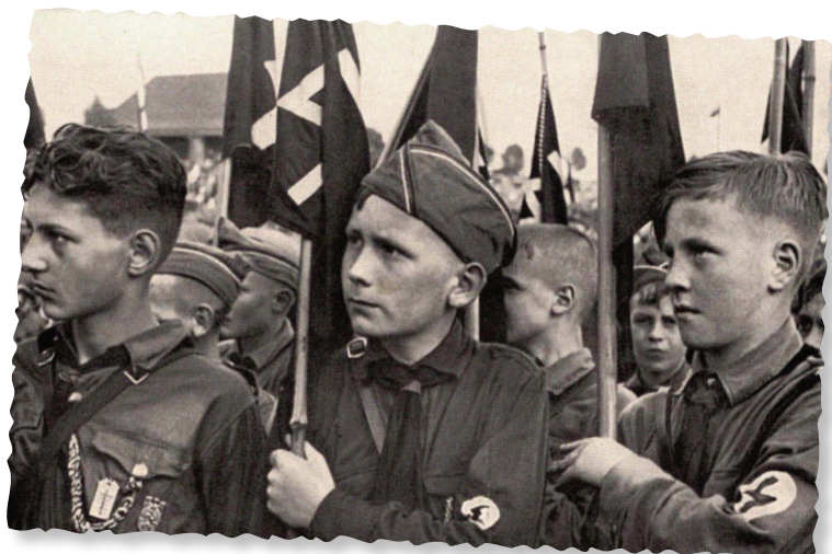
Miembros de la Juventud Hitleriana (Hitlerjugend), Alemania