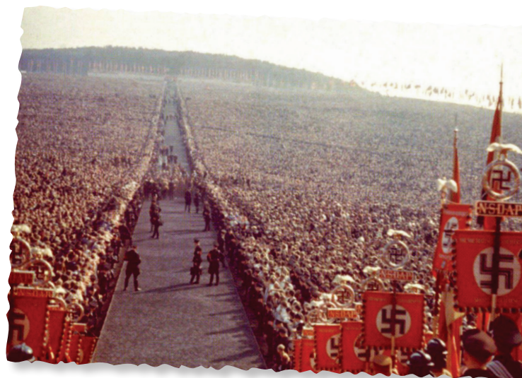
Un mitin nazi, Alemania, 1937