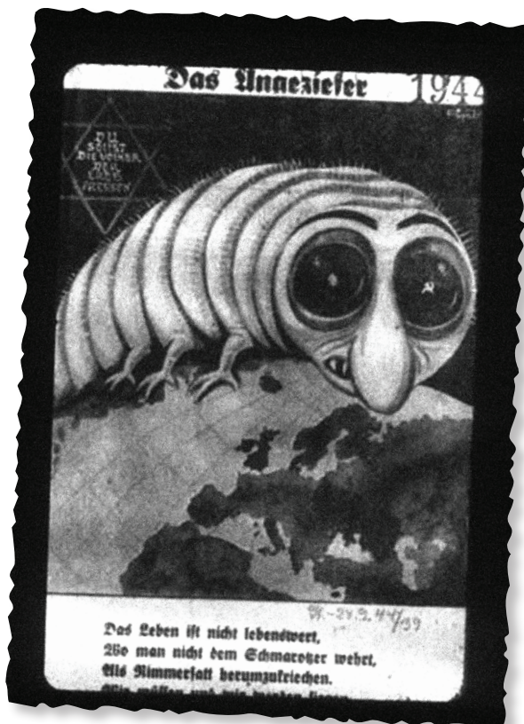
Caricatura nazi. Dentro de la estrella de David aparece la inscripción: "Roe las naciones del mundo"- Der Stürmer

Recomendamos debatir con los alumnos sobre la elección del gusano como símbolo representativo del judío y llamar la atención sobre los símbolos que aparecen en los ojos del gusano.