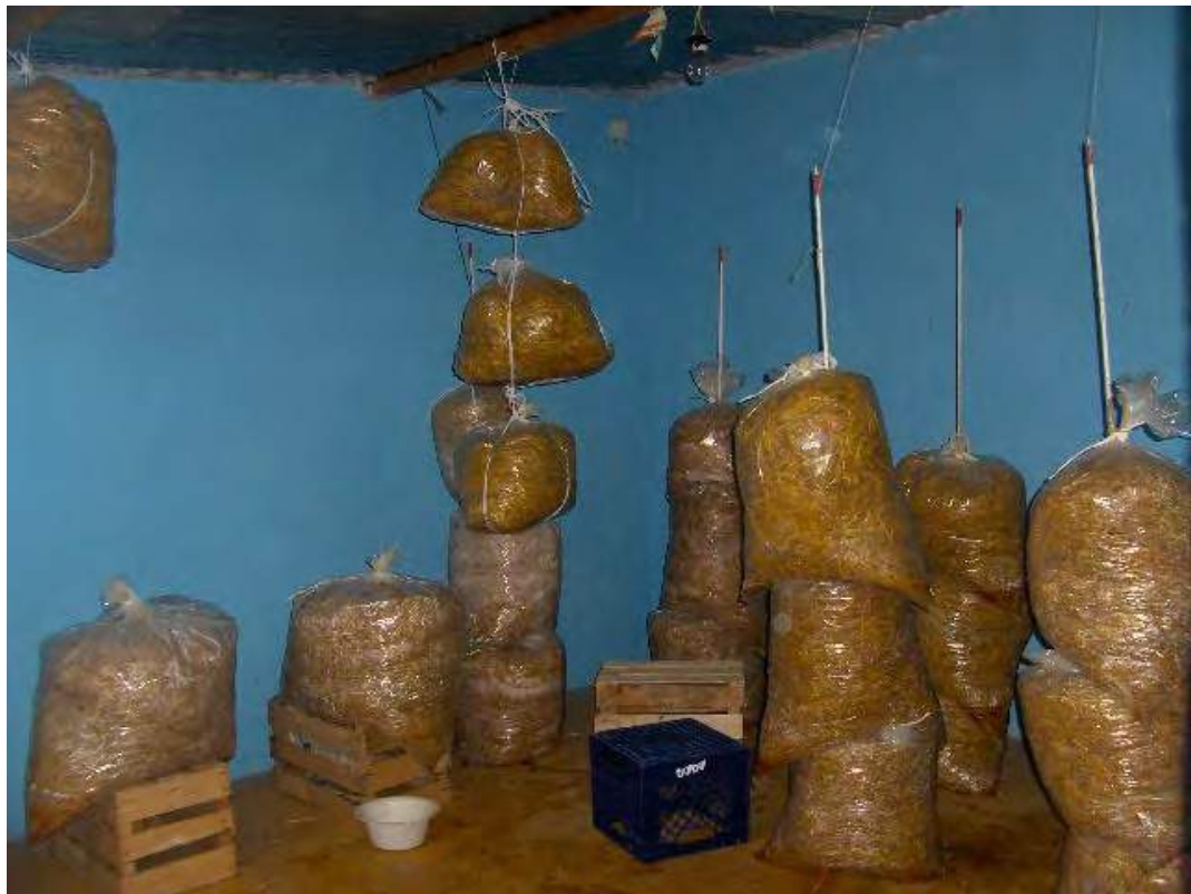
Fig. No 16 Reposo e incubación en forma individual, “chorizo” y brocheta.

Nada se debe de dejar a la memoria, porque a veces se olvida.