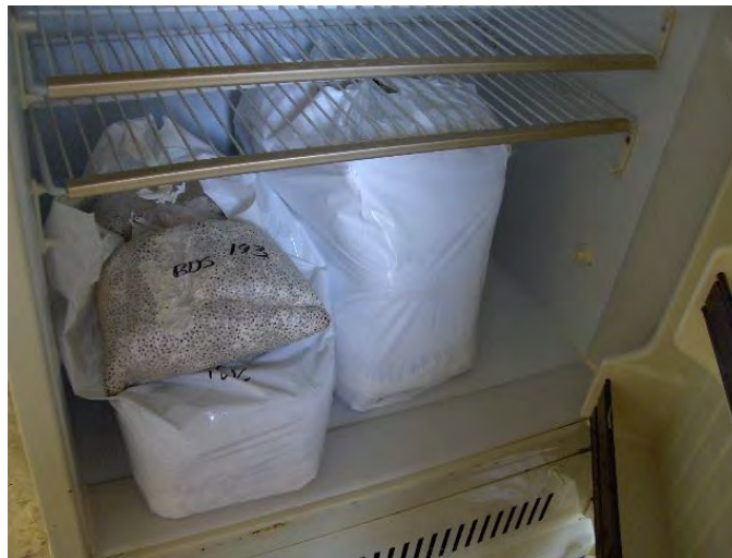
Fig. No. 9 El micelio se conserva en refrigeración en 5°C en buen estado.

Para hacer un cultivo de setas, el micelio se desgrana o desmenuza, con ambas manos previamente lavadas y desinfectadas con alcohol. Con mucho cuidado se manipula la masa compacta y amorfa de cereal, procurando no “raspar” o lastimar las hifas, no importando que queden algunos pequeños grumos, el micelio que sea derramado o que caiga de la vasija no es recomendable utilizarlo, se pudo haber contaminado. Las hifas a simple vista son una especie de algodoncillo, pero al microscopio son pequeños filamentos que en conjunto fructifican en pequeños primordios. Una vez desmenuzado el micelio, se deposita en una vasija previamente lavada y desinfectada con alcohol, en la cual permanecerá hasta la hora del cultivo, bien tapada con una manta de algodón húmeda para conservar sus propiedades y evitar que se deshidrate y contamine.