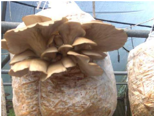
Fig. No.2 Pleurotus ostreatus , cultivados en invernadero en la Ciudad de México, como parte de las formas de agricultura urbana.

Su reproducción es llevada a cabo por medio de esporas, éstas en su conjunto forman el micelio, del cual surge el cuerpo del hongo o carpóforo, cuya vida y desarrollo es muy dinámico, sólo necesitan temperatura, humedad y cantidad de luz adecuada para crecer de las más variadas y caprichosas formas.