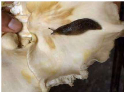
Fig. No 21 Babosa sobre una seta.

Los perjuicios causados por las cochinillas Armadillidium vulgare y babosas Deroceras reticulatum son devastadores, ya que los hongos son ruidos, por estos insectos y el comprador ya no acepta bien el producto. Estas plagas pueden combatirse esparciendo cal en pequeñas cantidades sobre el piso, paredes, rincones y recovecos. También pueden eliminarse de forma manual, lo importante es no esparcir insecticidas dentro del cultivo, para no contaminar los hongos.