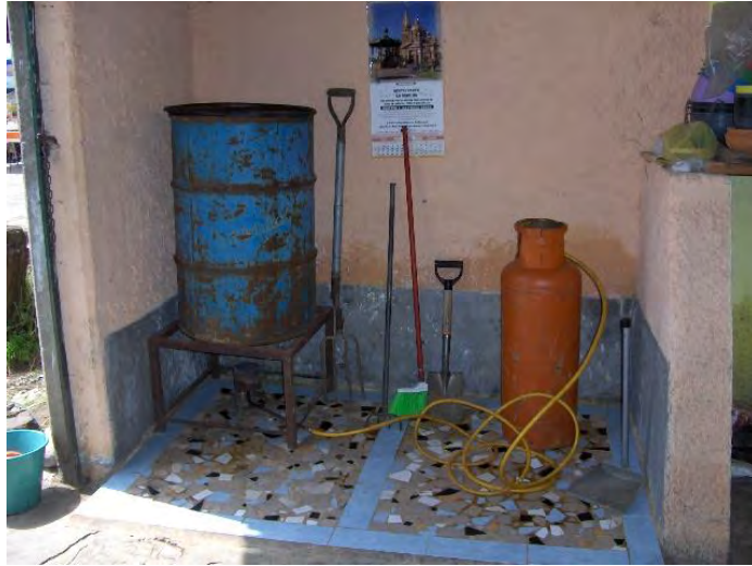
Fig. No. 6 La herramienta.

Actividad. El agricultor hará un recuento de la herramienta igual o similar a la de la lista con la que cuenta, para llevar a cabo esta actividad.