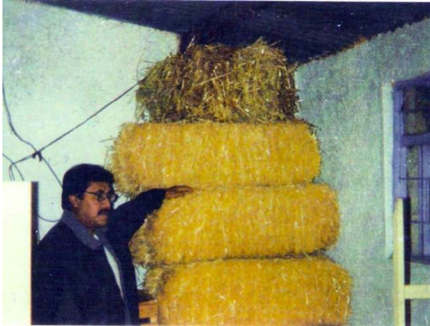
Fig. No.7 El sustrato. La paja más clara es de trigo la paca superior es de avena.

picada entre 15 y 20 cm., de largo para su mejor manejo y que no tenga mal olor. Por la calidad y cantidad de nutrientes se debe de elegir preferentemente la paja de trigo.