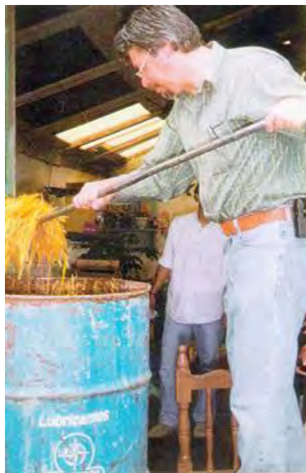
Fig. No. 12 Con un biello se saca la paja caliente del tambo para entibiarla y poder cultivar, esta herramienta sólo se utiliza exclusivamente para esta actividad.