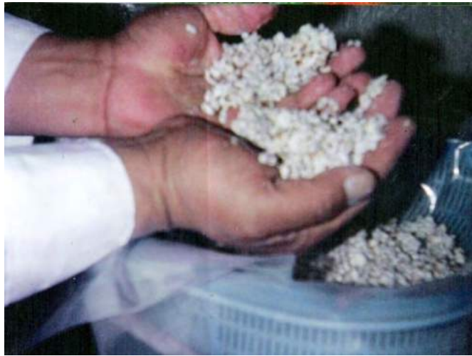
Fig. No. 8 Manipulando el micelio, procurando no lastimar las hifas.

más efectivo. Es por eso que se recomienda utilizar el micelio de laboratorio, en el micelio casero sólo puede confiar el productor que lo inoculó.