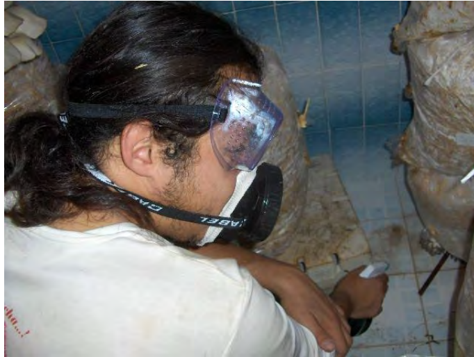
Fig. No 24. Protección con goggles y mascarilla.

Es importante que el capacitador advierta desde un principio de los riesgos que se corren cuando se inicia en esta actividad. Por ningún motivo las personas pueden pernoctar en el espacio destinado a la producción de hongos o tener cultivos en la sala o el baño.