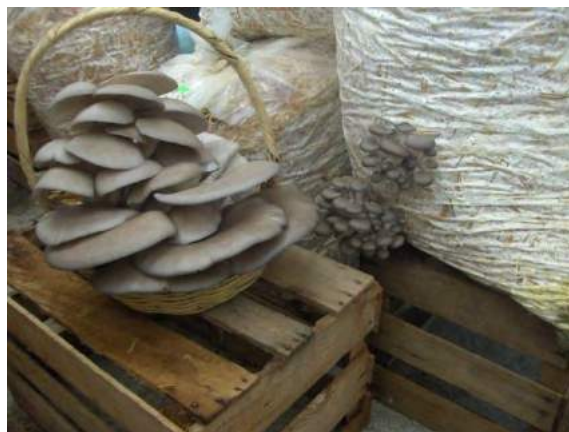
Fig. No. 23 Setas cosechadas con una talla propicia.

Por el contrario, si el tamaño del hongo es menor a 10 cm., el hongo será muy tierno y se van a requerir más matas de hongo para completar un kilogramo, pero resulta un producto de mayor calidad, mejor vendido y el sustrato durará más tiempo, 4 cosechas seguramente.