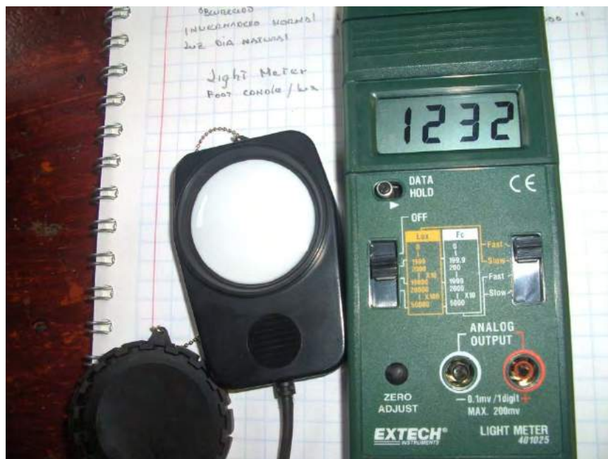
Fig. No.19 Luxómetro, mide la intensidad de la luz.

Actividades. El agricultor manipulará los parámetros agroclimáticos según se requiera, con las técnicas ilustradas en este capítulo.