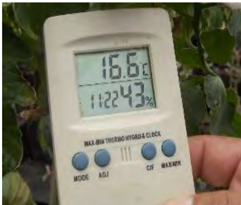
Fig. No.18 Termohigrómetro digital, miden la humedad relativa y la temperatura.