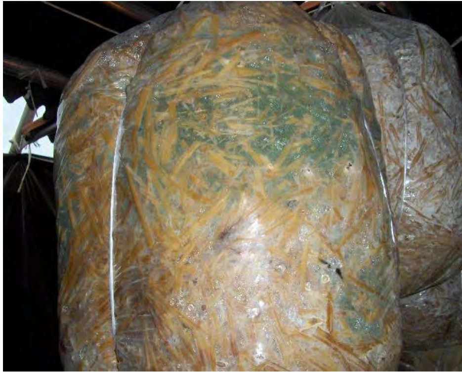
Fig. No. 20 Hongo de la penicilina aparece entre los 15 y 20 días de haber cultivado.

Con el brote de los primordios (hongos tiernos) van a aparecer mosquitos, cochinillas, babosas, etc. Esto ocurre por el intenso olor parecido al del anís dulce que despide el hongo y que resulta irresistible para dichos insectos, todo esto se puede evitar si se mantiene bien sellado el espacio de cultivo.