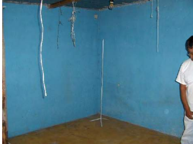
Fig. No. 5 El lugar del cultivo, debe de ser exclusivamente para cultivar hongos.

Actividades. El agricultor realizará la limpieza y desinfección del espacio en el cual reposará el cultivo durante su vida productiva, así como la revisión de puertas y ventilas para verificar que el espacio quede bien sellado. El agricultor revisará los instrumentos de medición a ocuparse durante la práctica del cultivo.