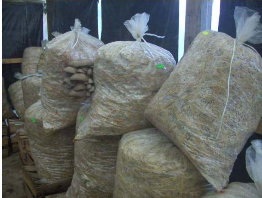
Fig. No. 17 reposo e incubación en batería para optimizar el espacio. Más practico, los cultivos no se aplastan, resisten bien el peso.

El acomodo en “batería” tiene la ventaja de que se incuban los pasteles muy juntos y así se optimiza el espacio. Se pueden reacomodar como mejor convenga a la hora de la fructificación, es mucho más práctico. No es el caso en la modalidad de “chorizo” o en brocheta.