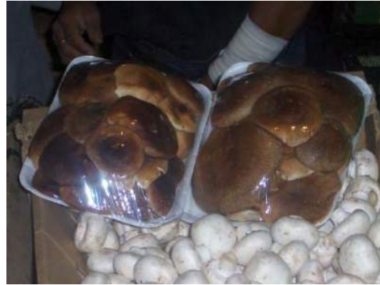
Fig. No. 3 y 4 hongos silvestres y cultivados. Con los hongos cultivados no hay riesgo alguno de intoxicación o envenenamiento.