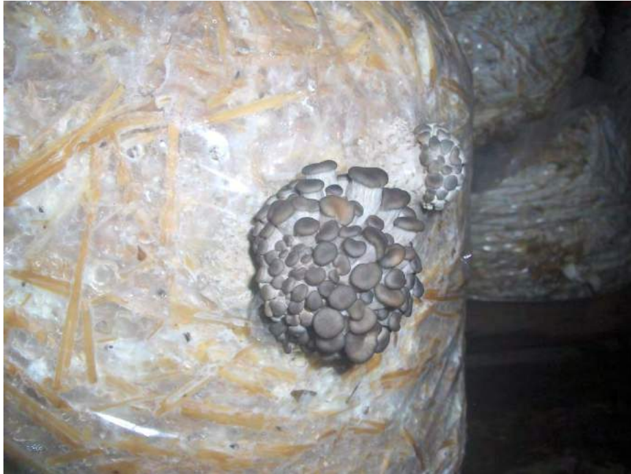
Fig. No. 22 Nacencia primordios muy succulentos.

La cosecha se da entre los 6 y 8 días, a partir del día de la nacencia. La mejor talla para comercializar el hongo seta, es de 10 a 14 cm. que es cuando se puede aprovechar el hongo por completo. A veces, hay matas que pueden crecer hasta 25 o más centímetros, pero resultan muy correosas y no se puede aprovechar completamente el pie del hongo; además, cuando las matas son muy grandes no son bien aceptadas por la gente y no se conservan por mucho tiempo. En general se devalúan y el sustrato se acaba con más rapidez, por lo que en lugar de esperar tres cosechas sólo se darán escasamente dos.