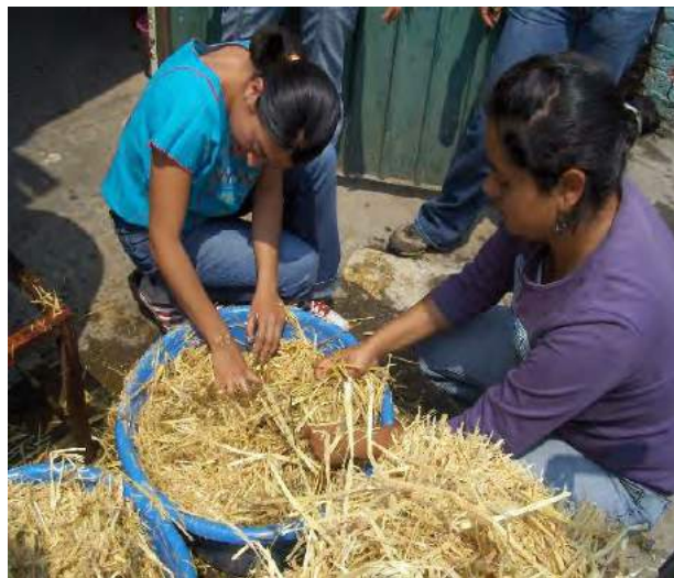
Fig. No. 10 Lavado y enjuague de la paja para liberarla de tierra y polvo.

En este paso del proceso del cultivo del hongo seta, se dará tratamiento al sustrato en el cual se va a cultivar, con la finalidad de eliminar las impurezas como polvo, restos de rastrojo ajenos a la paja, ácaros, insectos, bacterias, micelios de otros hongos no deseados, etc. En resumen, se enjuaga, humecta y acondiciona el sustrato, se corta en trozos (la paja de avena viene entera) de 15 a 20 cm. aproximadamente y se elimina la semilla que pudiera contener la paja para evitar su posible nacencia dentro de los paquetes o “pasteles” cultivados. Si nacen los granos de cereal se convierten en un problema posterior de contaminación, que se puede resolver en este delicado paso.