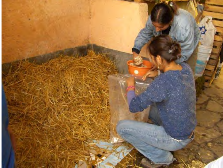
Fig. No. 14 Técnica de cultivo. Es recomendable que se haga entre dos personas, es más práctico.

Una vez cultivadas todas las bolsas se les pone una etiqueta, la cual contendrá la fecha de cultivo y la variedad de hongo cultivado. Posteriormente se les van a hacer 6 orificios a cada bolsa repartidos en toda la bolsa, con un objeto más grueso que un alfiler u otro objeto puntiagudo para permitir que salgan los gases generados como el bióxido de carbono, producto de la actividad bioquímica que se ha iniciado con el micelio incubándose en la paja. Hacer orificios a la bolsa es un detalle muy sencillo pero importante, ya que de no hacerse, el cultivo moriría irremediamente. Los orificios no deben ser muy grandes porque se corre el riesgo de que se contamine el cultivo, pero tampoco deben ser muy pequeños porque es por esos orificios que se desechan los gases generados