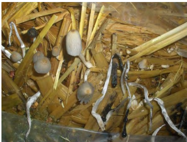
Fig. No.13 Un ejemplo de aparición de hongos ajenos a nuestro cultivo del tipo de Coprinus atramentarius seta venenosa que puede resultar mortal si se consume en exceso, como un síntoma de que la paja no fue bien pasteurizada, en este caso coexisten ambos hongos en el mismo pastel, pero pueden ser tóxicos por contaminación de esporas.

Actividades. El agricultor llevará a cabo el procedimiento de enjuagar la paja y de eliminar microorganismos y de micelios ajenos aplicando calor hasta lograr la pasteurización del sustrato.