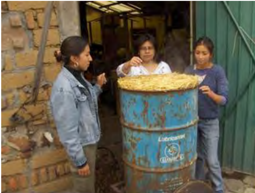
Fig. No. 11 Paja de trigo recién pasteurizada. Alcanzó una temperatura de 78°C, lo suficiente para librarla de microorganismos y de otros micelios.

manos en la lamina del tambo. No es necesario que llegue a la ebullición. Un tanque de 20 kilos de gas alcanza para 8 quemas.