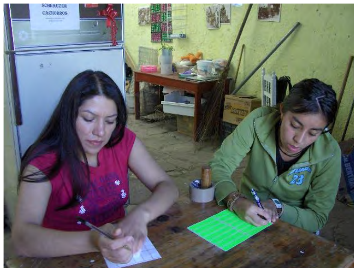
Fig. No. 15 Anotando los datos del cultivo en etiquetas, que posteriormente se pegarán en los pasteles.

Una vez cultivadas todas las bolsas se les pone una etiqueta, la cual contendrá la fecha de cultivo y la variedad de hongo cultivado. Posteriormente se les van a hacer 6 orificios a cada bolsa repartidos en toda la bolsa, con un objeto más grueso que un alfiler u otro objeto puntiagudo para permitir que salgan los gases generados como el bióxido de carbono, producto de la actividad bioquímica que se ha iniciado con el micelio incubándose en la paja. Hacer orificios a la bolsa es un detalle muy sencillo pero importante, ya que de no hacerse, el cultivo moriría irremediamente. Los orificios no deben ser muy grandes porque se corre el riesgo de que se contamine el cultivo, pero tampoco deben ser muy pequeños porque es por esos orificios que se desechan los gases generados