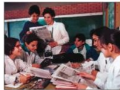
Los métodos lógicos

Son métodos lógicos aquellos que permiten la obtención o producción del conocimiento: inductivo, deductivo, analítico y sintético. La inducción, la deducción, el análisis y la síntesis, son procesos del conocimiento que se complementan dentro del método didáctico. En la actualidad, dentro de la óptica constructivista, los procedimientos que utiliza el docente se identifican con el método didáctico y las técnicas metodológicas; mientras que a los procedimientos lógicos que utiliza el estudiante para lograr el aprendizaje como la observación, la división, la clasificación, entre otras, se les denomina estrategias de aprendizaje.