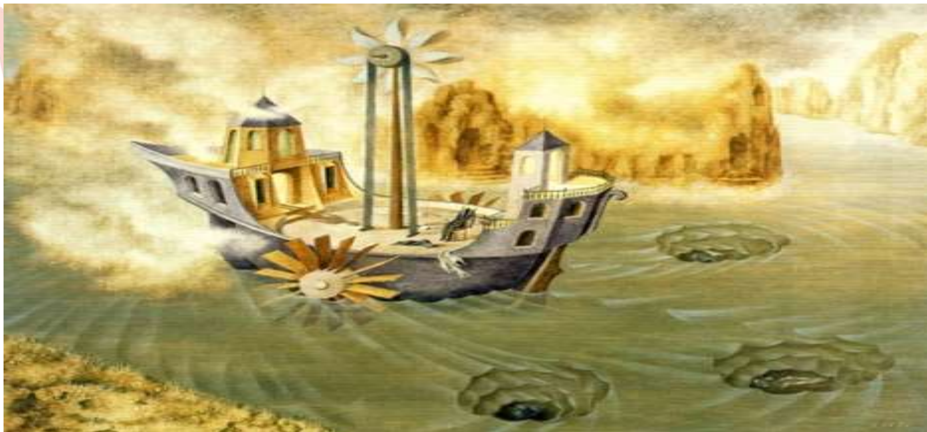
Remedios Varo, Trasmundo, 1955