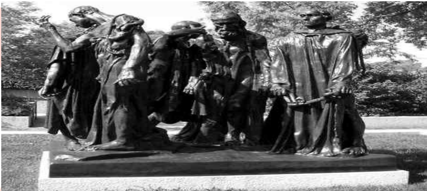
A. Rodin: "Los ciudadanos de Calais", París, Museo Rodin.