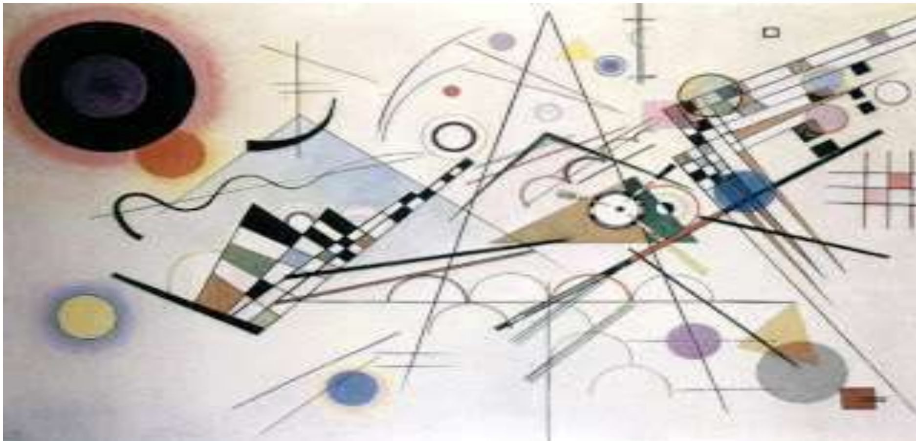
Vasili KANDINSKY, COMPOSICIÓN VIII 1923