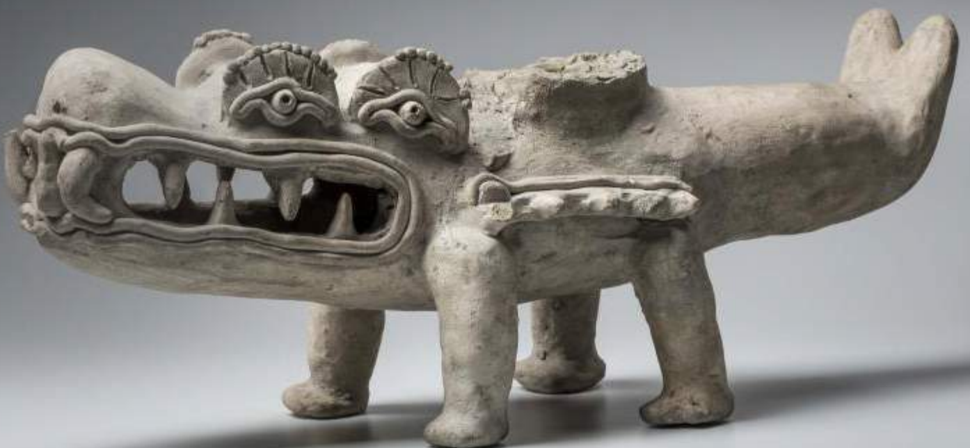
Caimán mítico con cuatro ojos Cultura La Tolita (- 400 a. C. - 400 d. C.)

Las ceremonias de curación buscan restablecer el equilibrio perdido. Los aspectos constitutivos del ser humano (físico, mental, emocional, espiritual) son abordados de manera global. Los chamanes conocen los secretos de las plantas psicotrópicas, como el tabaco o la ayahuasca, que tiene el poder de curar, de equilibrar, y de purificar.