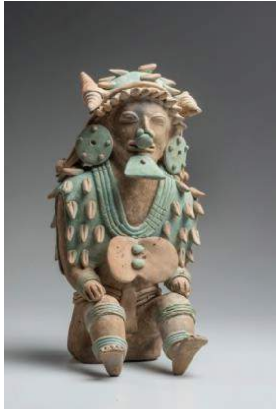
Personaje con tocado de conchas marinas Cultura Jama Coaque (-350 a.C. – 400d.C.) Cerámica

Los ornamentos en oro se distinguen particularmente pues expresan la fuerza vital del cosmos, en especial la del sol.