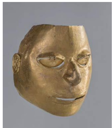
Máscara antropomorfa Cultura La Tolita. (-400 a. C. – 400 d. C.) Oro

El chamán se convierte así en mediador social entre el pueblo y estos grandiosos animales, seres míticos que le confieren su fuerza espiritual. Al convertirse temporalmente en deidad o en ser fantástico que domina el mundo, el chamán impone una ideología fundada en el sistema de valores andinos, según la cual los dioses no son externos, atemporales y extraños a la naturaleza, sino que forman parte de un todo que incluye al ser humano y a la sociedad.