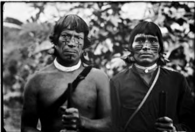
Fotógrafo no identificado. Aborígenes Shuar preparándose para la caza, aprox. 1925. Región de Morona Santiago. Negativo al gelatino-bromuro sobre vidrio. © Instituto Nacional de Patrimonio Cultural de Ecuador

En las actitudes corporales de unos y de otros, se vislumbra un resumen intenso de las fuerzas en juego.