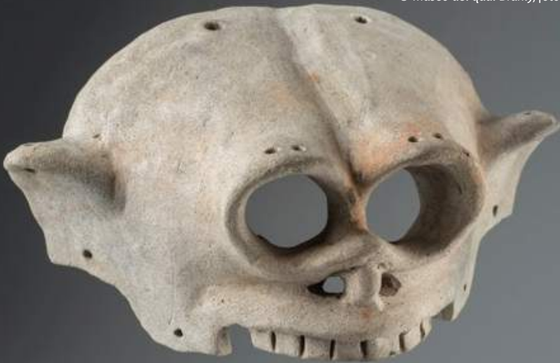
Máscara que representa una cabeza de muerto Cultura La Tolita (- 400 a. C. – 400 d. C.)

La muerte tiene una gran importancia y supone un regreso al vientre de la Madre Tierra para luego renacer. Existen diversas prácticas mortuorias, según la posición social del individuo. El tratamiento de su cuerpo es, en consecuencia, diferente según las personas: algunas son enterradas en tumbas simples o fastuosas, sólo los personajes extremadamente importantes eran envueltos en fardos.