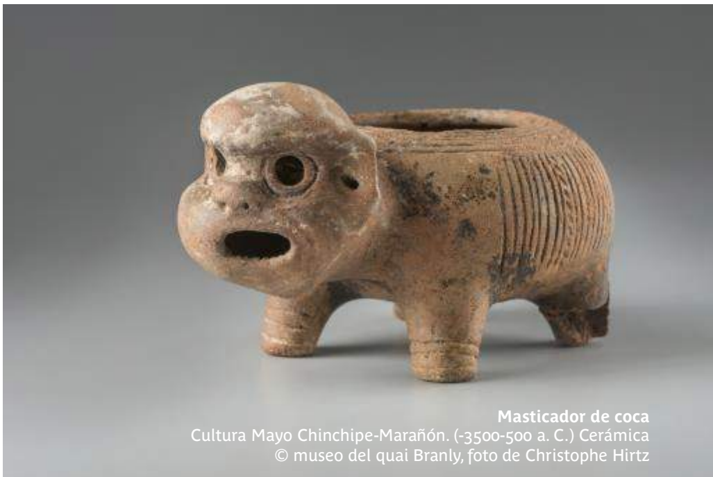
Masticador de coca Cultura Mayo Chinchipe-Marañón. (-3500-500 a. C.) Cerámica

Los sacrificios consisten en ofrecer a las deidades la sangre de ciertos animales y de prisioneros de guerra. Es un sacrificio de muerte para que sea otorgada la vida. Se ofrece un tesoro líquido a cambio de otro tesoro vital: el agua, indispensable para la fertilidad de los campos. El principal sacrificio para satisfacer a los dioses es el de la sangre humana, cuyo valor supera al de la sangre animal.