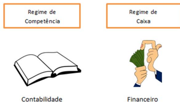
Figura 2: Regime Competência X Regime Caixa

Pelo regime de competência , a data onde cada compra foi realizada no decorrer do mês, onde houve o fato gerador de cada despesa.