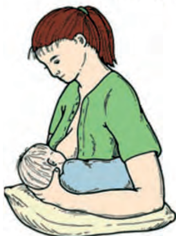
Balón de rugby