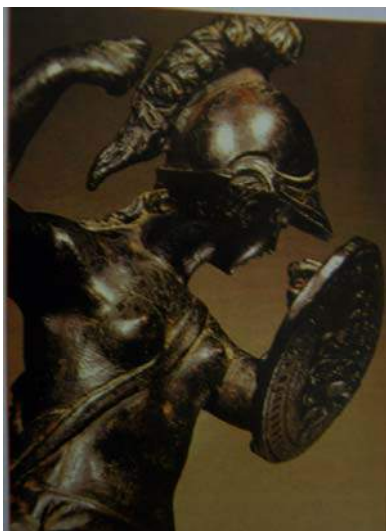
Figura n° 2. Escultura de la diosa Minerva

A partir de estos elementos nos interesa analizar las configuraciones de lo femenino en las diosas del mundo romano. Minerva era la diosa de las artes, los oficios y la guerra y también la diosa de la sabiduría. Muchas de estas funciones respondían a la influencia y asimilación con la Atenea griega.