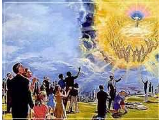
Jesús subió al cielo delante de los apóstoles y algún día regresará en su Segunda Venida y todo ojo lo verá