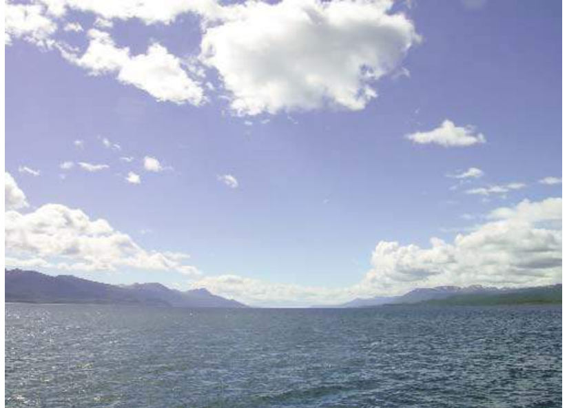
• Tales de Mileto afirmó que el agua es el principio de todas las cosas.

Los presocráticos, denominados así por ser los filósofos anteriores a Sócrates, razonaron sobre la naturaleza desde los conceptos especulativas de fenómeno , “lo que se aparece o muestra a los sentidos” (φαίνω), y principio o arkhé (αρχή), que significa “origen o fundamento”. Para los presocráticos el conocimiento de la naturaleza comienza con la imagen cambiante del mundo que nos ofrecen los sentidos. Sin embargo, esta diversidad aparente de la materia está sometida a un principio ordenador, oculto a la vista pero conocido por la razón. El arkhé es lo que ya estaba desde el principio, lo que no está sometido al cambio permanente.