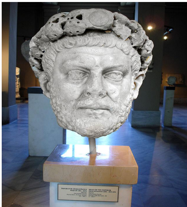
Busto de una estatua del emperador romano Diocleciano en el Museo Arqueológico de Estambul.

La consistente lealtad de Maximiano hacia Diocleciano demostró ser un importante componente de los primeros éxitos de la tetrarquía