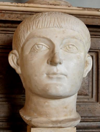
HONORIO EMPERADOR ROMANO DE OCCIDENTE CAPITAL ROMA