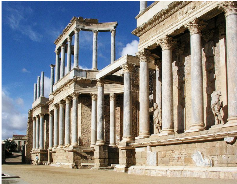
Teatro romano de Mérida, ubicado en la antigua colonia romana de Augusta Emerita.