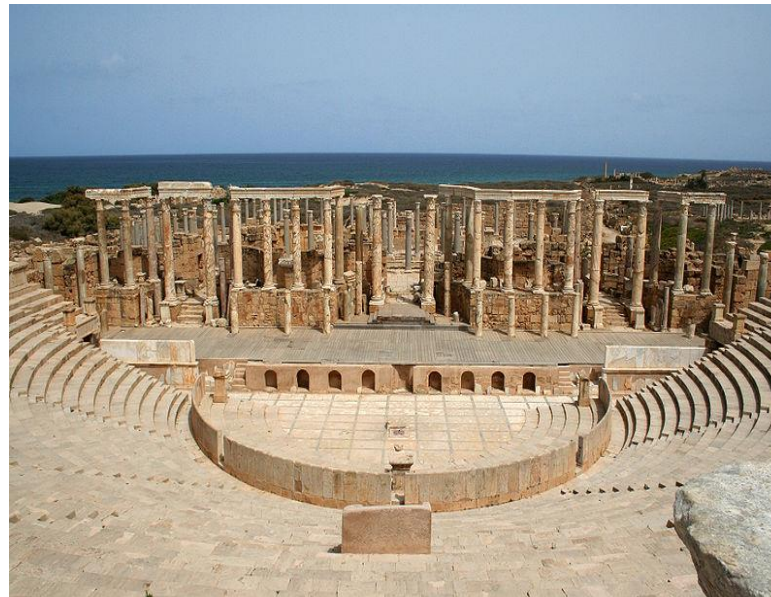
Anfiteatro de la ciudad romana de Leptis Magna.