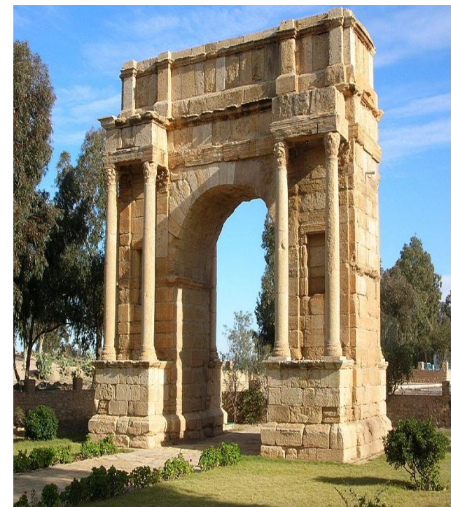
Arco triunfal de la tetrarquía, Sbeitla, Túnez