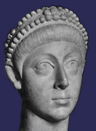
ARCADIO EMPERADOR ROMANO DE ORIENTE CAPITAL CONSTANTINOPLA