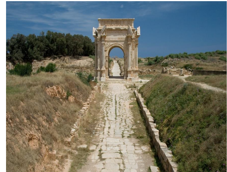
Arco triunfal romano en Leptis Magna. Libia, como todos los países mediterráneos, ha visto el paso de muchas culturas, entre ellas la romana.