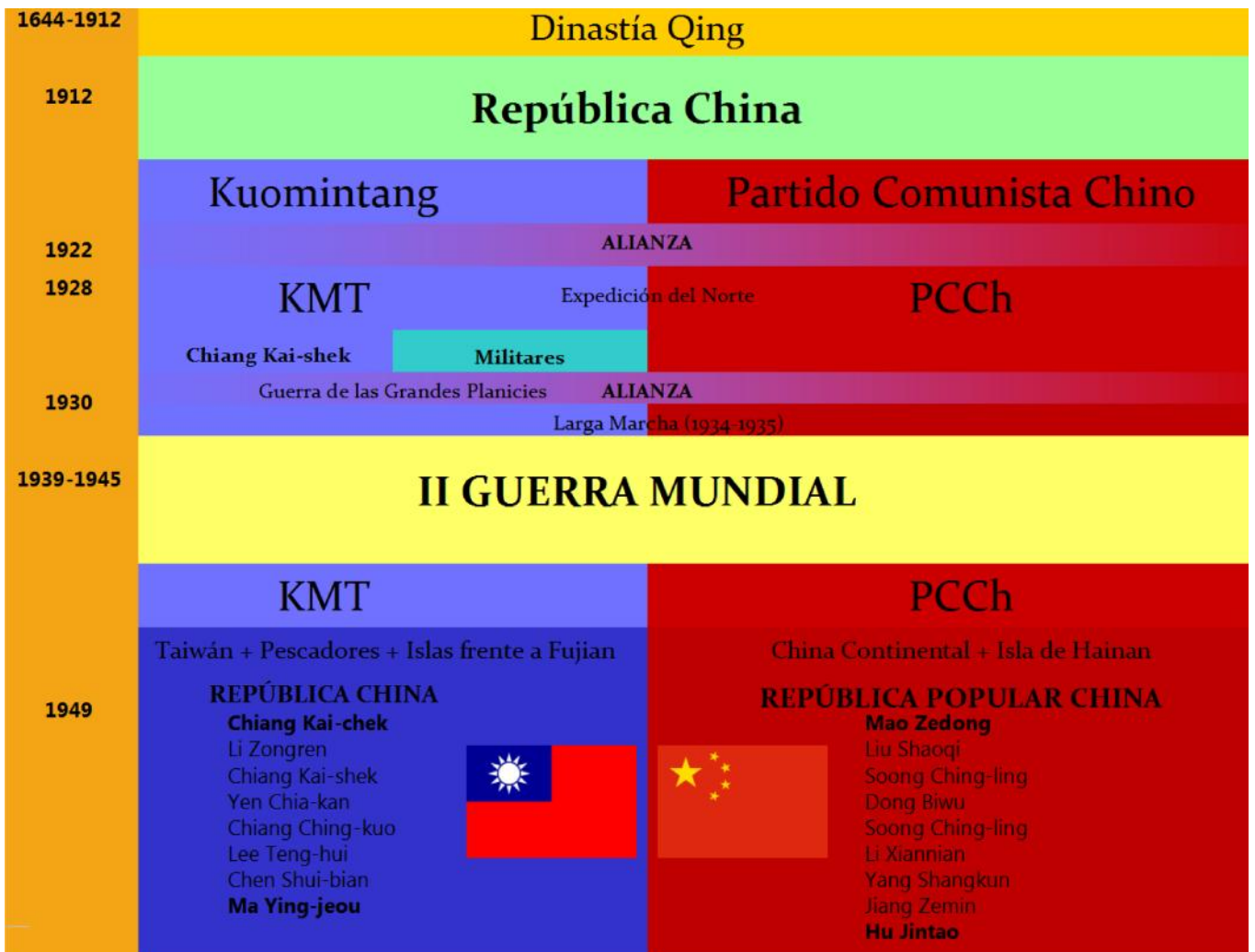
Esquema-resumen de la Guerra Civil China