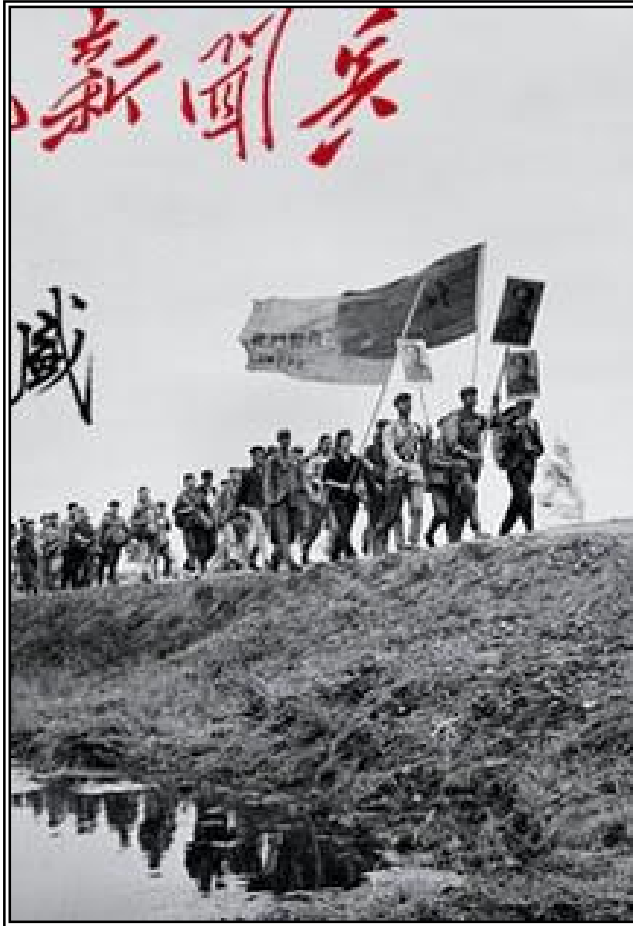
Expedición del Norte

KMT también crecía. Esta acción se consideró imprescindible porque había que librar a China del feudalismo y porque los señores de la guerra debilitaban al país frente al expansionismo nipón.