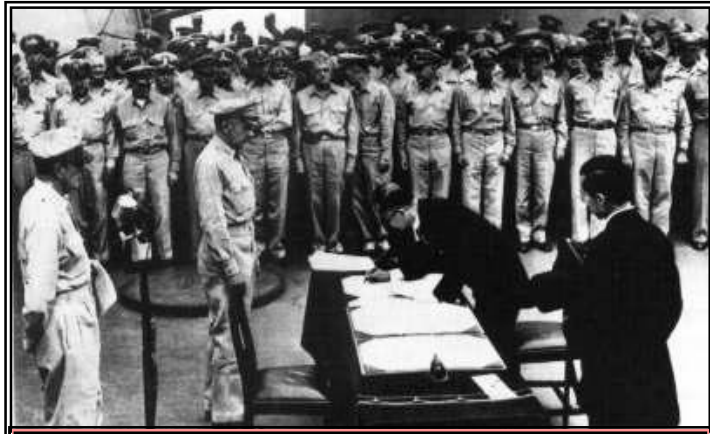
Rendición japonesa en la Segunda Guerra Mundial

tropas niponas. Los comunistas chinos desempeñaron un papel muy importante en la lucha contra los japoneses y consiguieron ganarse el apoyo de los campesinos gracias a las medidas revolucionarias que se ponían en práctica en los territorios bajo control comunista: reparto de las tierras, aplazamiento de deudas, limitación de impuestos etcétera.