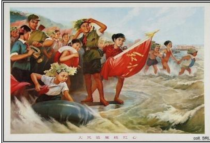
Dibujos comunistas que idealizaban la Larga Marcha, transformándola de huída a desfile heroico.

llanuras de centrales de China (de donde toma el nombre) acabará en noviembre del mismo año con el hundimiento de la coalición de los señores de la guerra.