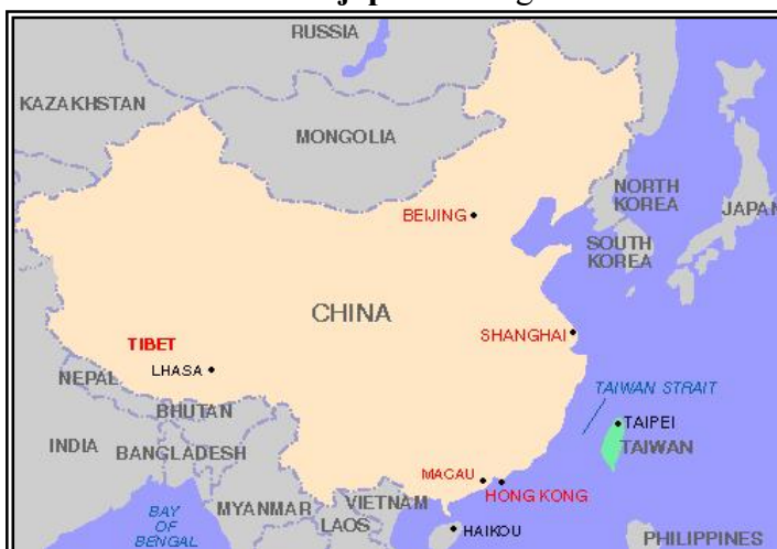
República Popular China (continente) y República China (Taiwán, en verde)

La rendición japonesa significó la continuación de la Guerra Civil que