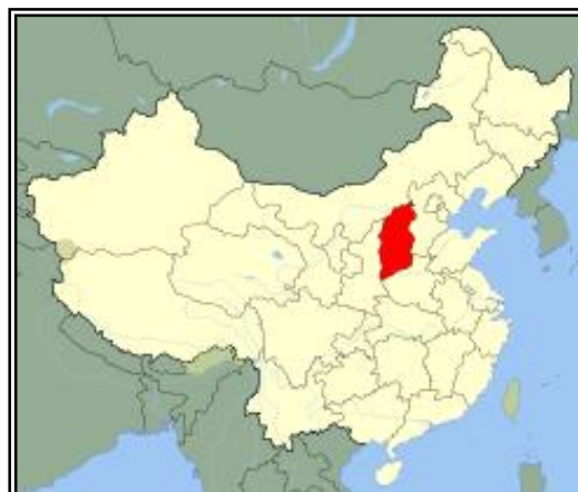
Soviet de Jiangxi

Guerra de las Planicies Centrales (1930). Sin embargo, los problemas internos florecerán en mayo de 1930 dando lugar a la Guerra de las Planicies Centrales . Este conflicto dividió al Kuomintang y enfrentó a las fuerzas de Chiang Kai-chek con las de la coalición de tres comandantes militares que se unieron al partido tras la Expedición del Norte (Yan Xishan, Feng Yuxiang y Li Zongren). La guerra, que tuvo lugar en las