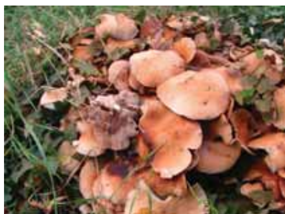
2.5 Agrocybe aegerita , una especie saprófita comestible que crece sobre la cepa de un árbol en Bolonia, Italia. Esta especie también es cultivada.