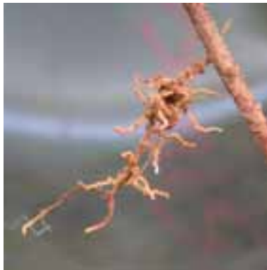
2.1 Ectomicorriza. La materia blanca que envuelve las raíces indica la “vainita” micótica.

Los hongos obtienen su nutrimento simbióticamente, de forma saprófita o parasítica (patógenos). Cada categoría contiene macrohongos comestibles. Las especies más valiosas son ectomicorrízicas: una especie de simbiosis. Las raíces ectomicorrízicas tienen una forma distinta y variada. Es bastante difícil observarlas in situ . Muchos macromicetos saprófitos son comestibles. Pocos patógenos se comen. Todos los ejemplos son de Malawi a menos que se especifique diversamente.