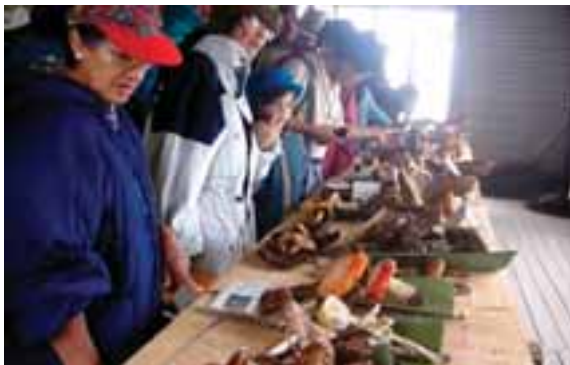
7.1 Ferias de hongos para levantar conciencia de las especies comestibles. Oaxaca, México.

La fuerte tradición de recolección y consumo de HSC se extiende desde México hasta Guatemala y luego parece interrumpirse repentinamente. Sólo hay un registro (que aquí ilustramos) sobre Bolivia. En la zona del Caribe también es ausente la tradición de consumo de HSC, aunque recordamos de nuevo que los haitianos consumen regularmente el djon djon donde quiera que vayan.