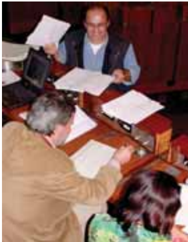
4.4 Corrección de los exámenes efectuados por los recolectores de trufas en Bolonia, para averiguar si saben dónde y cómo recolectar.