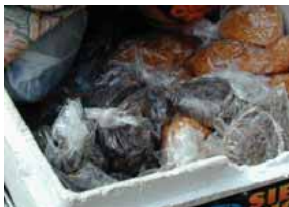
7.7 Los djon djon frescos son cultivados en Haití y exportados a Estados Unidos, Canadá y otros países. Brooklyn, Nueva York.