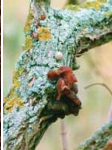
1.3 Auricularia aurícula-judae , uno de los hongos comunes en forma de oreja. Comestible. Francia. Cultivado ampliamente.