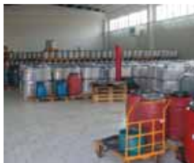
5.9 Porcini y otros hongos en conserva, importados del extranjero.