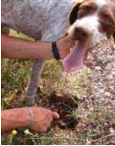
4.1 Luna encuentra las trufas y pide su recompensa. Se prefiere los perros cazadores de trufas a las cerdas porque causan menos daños y se controlan mejor.

La recolección y la cultivación de las trufas (sp. Tuber ) es de importancia comercial. Las trufas fotografiadas son de la Urbino, en la región de las Marcas (Italia), y pertenecen al género Tuber aestivum , a menos que sea especificado diversamente.