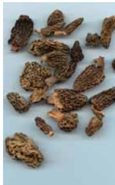
9.3 Hongos colmenilla secos, comprados en Bélgica.