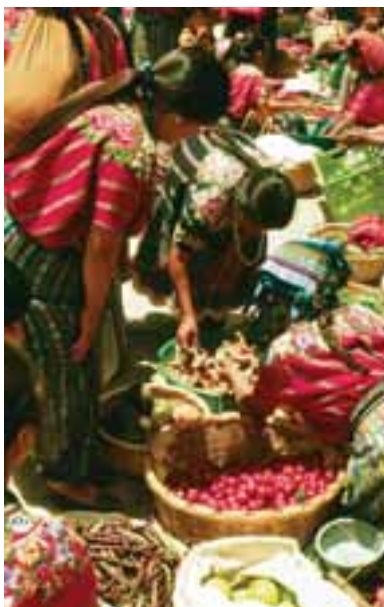
7.3 Mercado de Patzún, Guatemala. Lactarius deliciosus y L. Indigos en venta (en la mano y en el cesto).