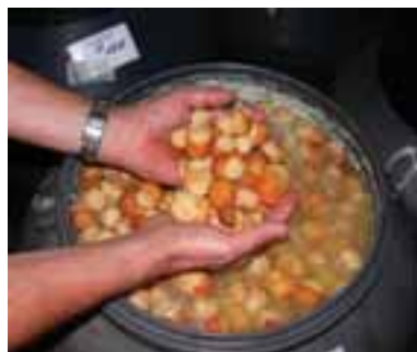
5.12 Especie jóvenes de porcini en salmuera.