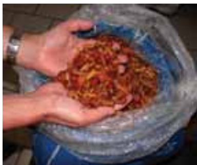
5.11 Pholiota mameko de China, también vendido junto a los porcini