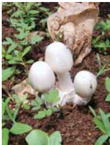
2.6 Volvariella volvacea . Comúnmente cultivado, es un hongo saprófita. Indonesia. Comestible.