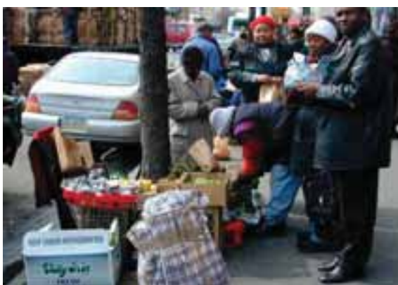
7.6 Las comunidades haitianas en todo el mundo compran a menudo djon djon , especie de la familia Psathyrella , Nueva York.