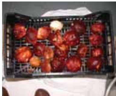
5.2 Preparación de porcini frescos para ser cocinados y para conservas antes de ser vendidos.