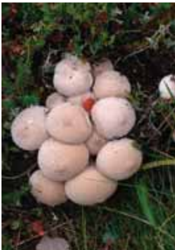
1.6 (Izq.) Sp. Lycoperdon , Noruega. Abombados. Crecen por doquier y se comen regularmente, aunque en cantidades reducidas.