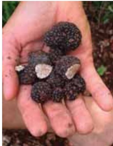
4.5 Tuber aestivum , cortado para mostrar su carne característica.