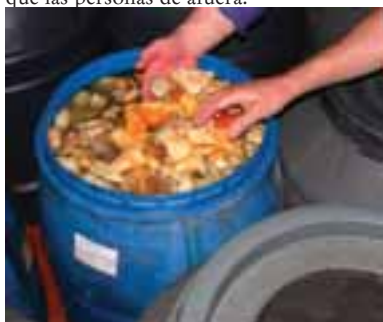
5.10 Otras especies de Boletus a veces son mezcladas con otros porcini para ser vendidos.