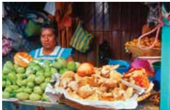
7.2 Mercado local de Oaxaca, México; los HSC se exhiben a la derecha ( Amanitas? ) y al frente de la vendedora.