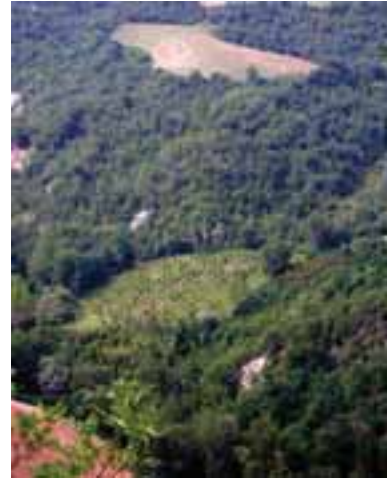
4.3 El claro es una tartufaia ("huerto" de trufas, en italiano) o truffière (en francés). Los árboles son infectados artificialmente con este hongo.