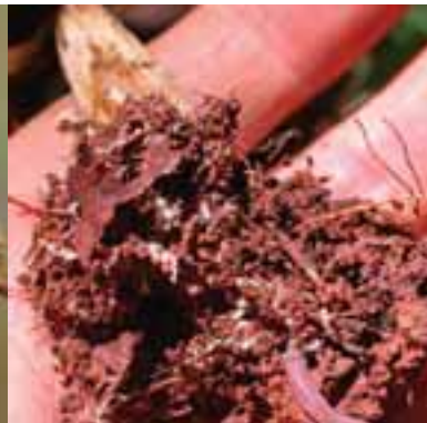
2.3 Estas ectomicorrizas son pequeñas y esponjosas. El micelio en el suelo puede tener una forma similar.