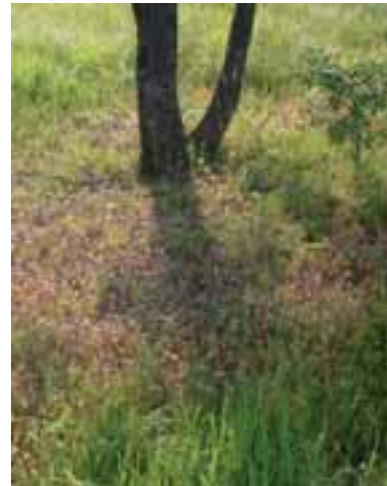
4.6 La vegetación suprimida ( brûlée ) revela la presencia de Tuber aestivum .