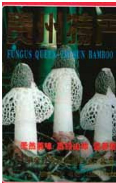
9.1 Presentación del Phallus impudicus .