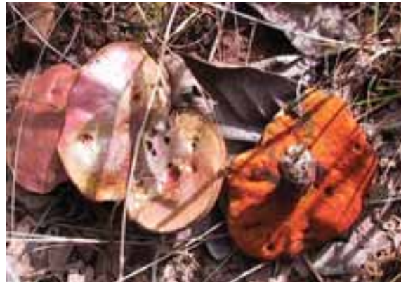
1.5 Este Afroboletus tiene una densa red de poros diminutos en la parte inferior del sombrero.