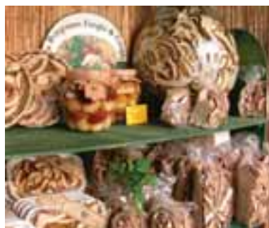
5.6 Porcini secos y en conserva de venta.