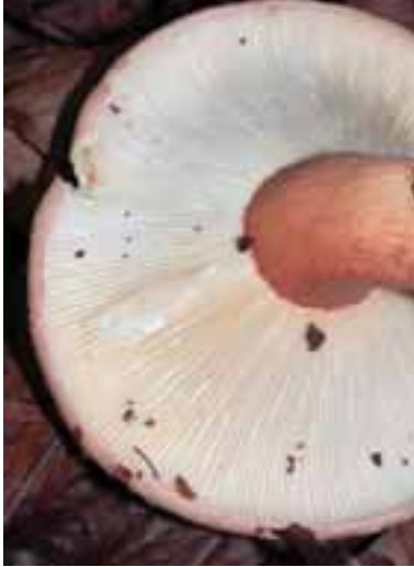
1.1 Sp. Lactarius , tras romper los filamentos se observa un fluido blanco. Muchas especies son comestibles y todas son micorrízicas.

Los hongos comestibles crecen en varias formas y tamaños. No hay elementos característicos (o exámenes) que ayuden distinguirlos de sus variedades venenosas. Los ejemplos son de Malawi y las fotos de Eric Boa, a menos que se especifique diversamente.