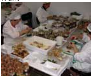
5.4 Preparación de envases de porcini y otros hongos.