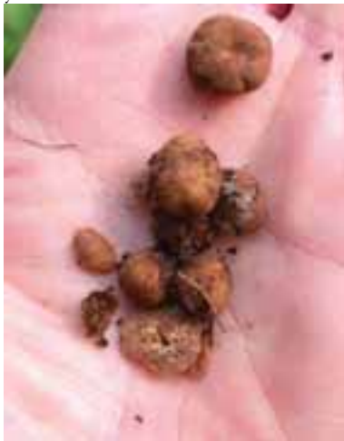
4.7 Tuber excavatum , de poco valor. No todas las trufas tienen precios iguales. Presente en los mismos sitios que las T. aestivum .