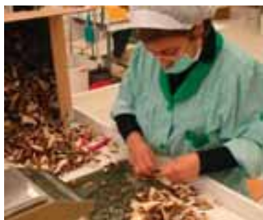
5.8 Porcini secos de varios países cuidadosamente clasificados.