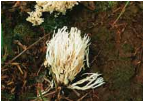
1.4 Sp. Ramaria , hay una gran cantidad de variedades similares que se comen en todo el mundo.