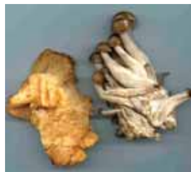
9.4 (Arriba) Hydnum repandum frescos (izquierda observe las espinas, sin filamentos) e Hypsizygus tessulatus de venta en un supermercado del Reino Unido.