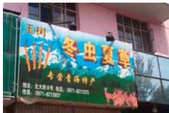
9.7 Publicidad del chongcao ( Cordyceps sinensis ) las "ramitas" naranjas a la izquierda, en Xining, China.