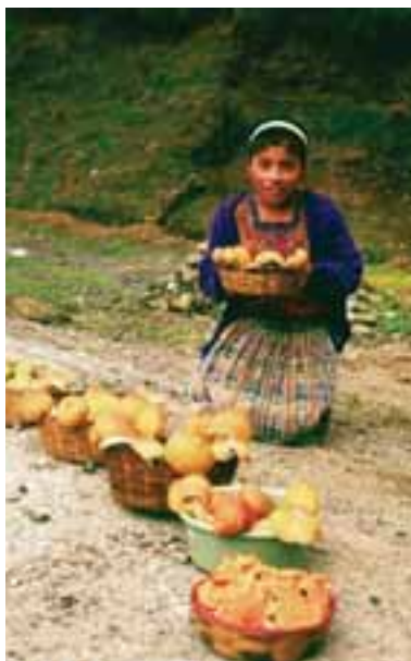
7.4 Vendedora a orillas del camino de penetración, Guatemala, con Lactarius deliciosus y Amanitas caliptrodermas .