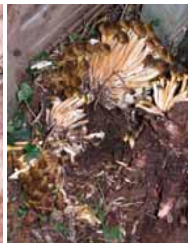
2.8 Armillaria mellea , un árbol patógeno, en la base de un laburno muerto. Londres. Comestible.