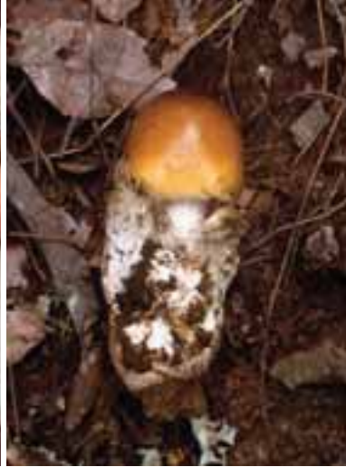
1.2 Amanita loosii , comestible. La volva es una característica particular del Amanita , un género que incluye especies venenosas.