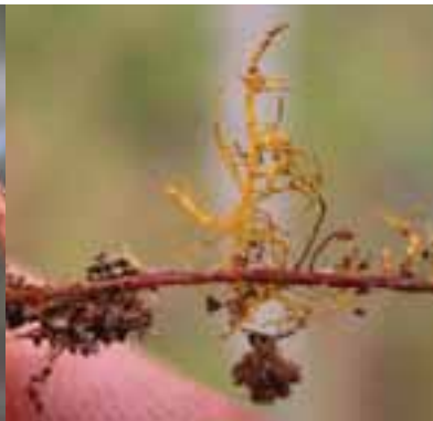
2.2 Esta característica ectomicorriza amarilla está asociada con una sp. Cantharellus .