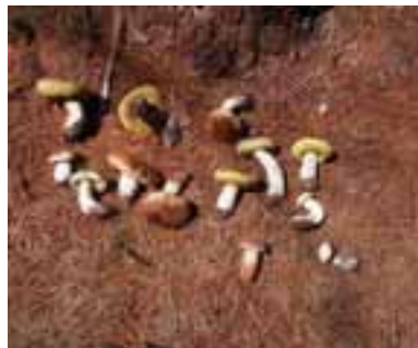
5.1 B. edulis producidos en abundancia aunque no son consumidos o recolectados. Plantaciones de pino, meseta de Zomba, Malawi.

Estos hongos silvestres apetecibles y muy demandados crecen en todo el mundo aunque no se consumen en algunos países, por ejemplo, Malawi. El comercio está dominado por los italianos, tanto en su país (fábricas) como en el resto del mundo (como comerciantes). Se exportan grandes cantidades desde China, Europa del este y Sudáfrica. Conocidos en Italia como porcini se secan para ser vendidos, a veces, en mezclas con otras especies de Boletus y otras setas cultivadas. Todas las fotografías son de Borgo Val de Toro, Parma (Italia) y fueron tomadas por Eric Boa, a menos que se especifique diversamente.