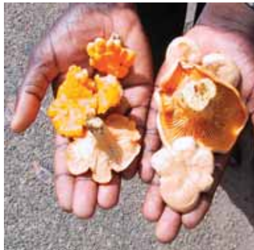
1.7 (Der.) Sp. Cantharellus , el himenio se extiende hasta una parte del estípite y los carpóforos tienen una apariencia característica.