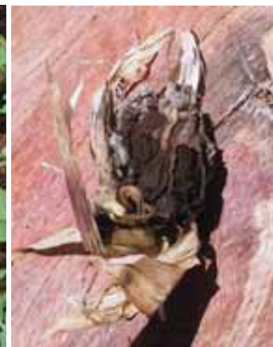
2.7 Mazorca de maíz infectada por el Ustilago maydis , Bolivia. Las infecciones en estadio temprano se comen como huilacoche en México.