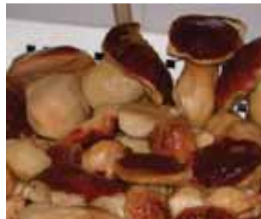
5.3 Porcini cocinados y listos para ser envasados.