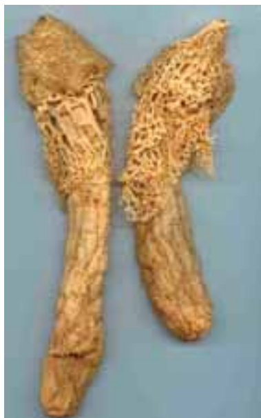
9.2 Phallus impudicus secos.