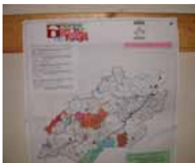
5.7 Se necesita un permiso especial para recolectar hongos en esta región. Los residentes y propietarios pagan menos que las personas de afuera.