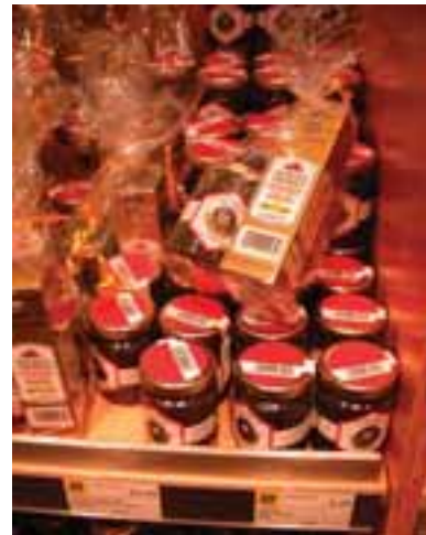
4.9 Tuber magnatum en venta como un alimento exclusivo, cuesta unos 35 $ EE.UU. al tarro.