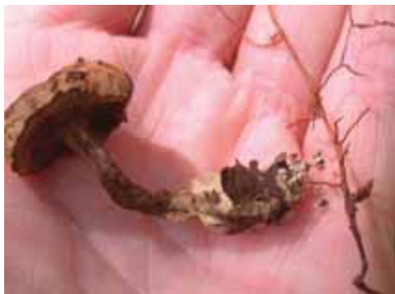
2.4 Al constatar esta conexión física con las raíces de un árbol es posible detallar la simbiosis que existe entre éste y el hongo.