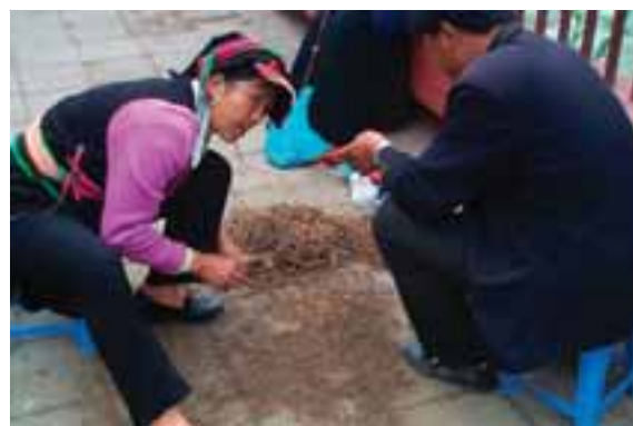
9.8 Limpiando los chongcaos en Kangding, China, durante la preparación para la venta.