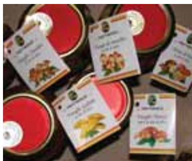
5.5 Un grupo de productos micóticos, incluyendo especies Cantbarellus y Ustilagos .