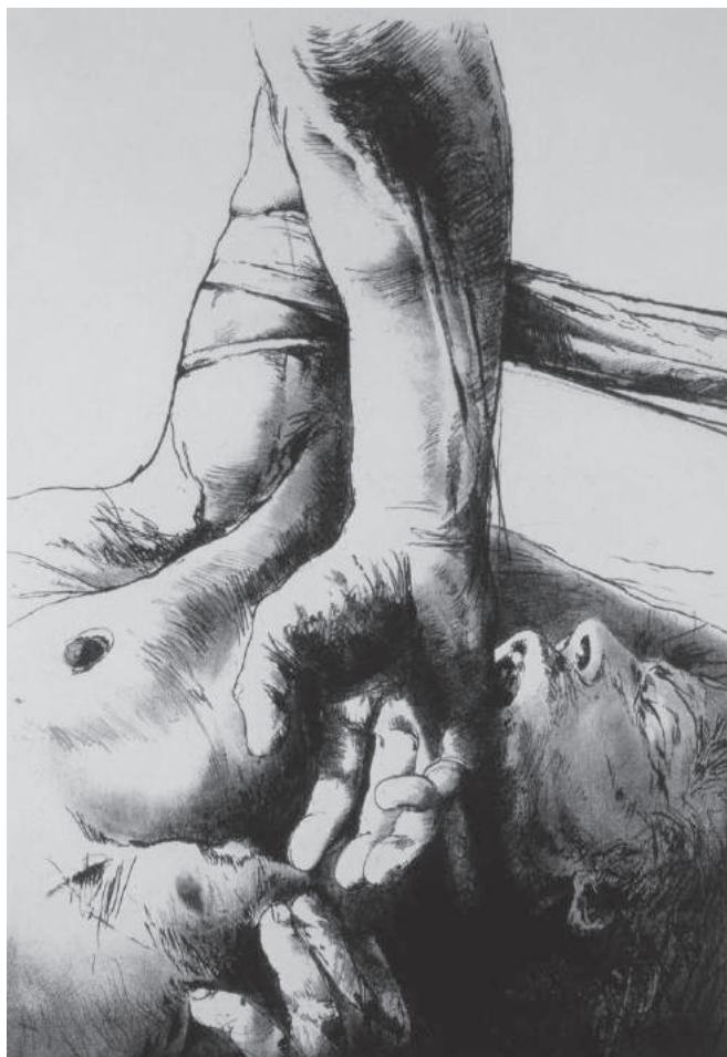
Luis Caballero, (ilustración para el libro "La noche oscura" de San Juan de la Cruz), litografía sobre papel, 1977. No.34/60, 53 x 38 cm (Reg. 0802). Colección Banco de la República

Construidas desde la sobrevaloración de la dimensión terapéu-