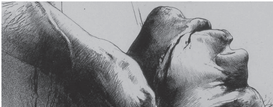
Luis Caballero, sin título (ilustración para el libro “La noche oscura” de San Juan de la Cruz), litografía sobre papel, 1977. No.34/60, 53 x 38 cm (Reg. 0797). Colección Banco de la República (detalle).

En la actualidad, el neochamanismo (o mejor, los neochamanismos) representa solo una parte de las cientos de corrientes y mo-