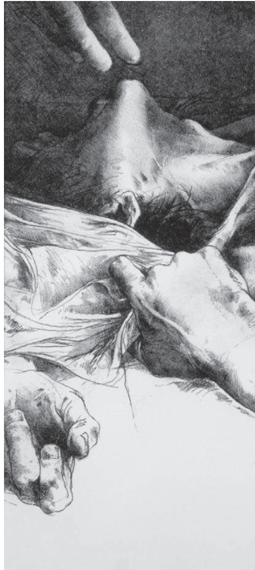
Luis Caballero, ilustración para el libro “Le chateau de hors”, litografía sobre papel, 1979, hc, 40 x 30 (Reg 1066). Colección Banco de la República (detalle)

El efecto de decodificación que instaura el capital lleva a los consumidores a resignificar y a reinterpretar, de acuerdo con sus propias