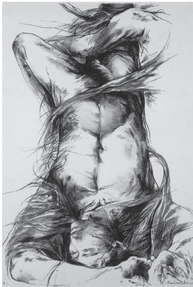
Luis Caballero, ilustración para el libro “Le chateau de hors”, litografía sobre papel, 1979, 40 x 30 (Reg 1063). Colección Banco de la República

Desde cierto ángulo, las lecturas del neochamanismo como propuesta contra-hegemónica o como reacción a la modernidad pueden resultar tramposas. A decir verdad, estaríamos frente a una propuesta que surge menos como reacción al proyecto moderno que como su resultado. El chamanismo podría considerarse entonces como un paradigma de la dialéctica de la racionalidad, de la ciencia y de la fascinación por el “otro” irracional. Lo irracional, o mejor, lo no-racional “como fundamento de conoci-