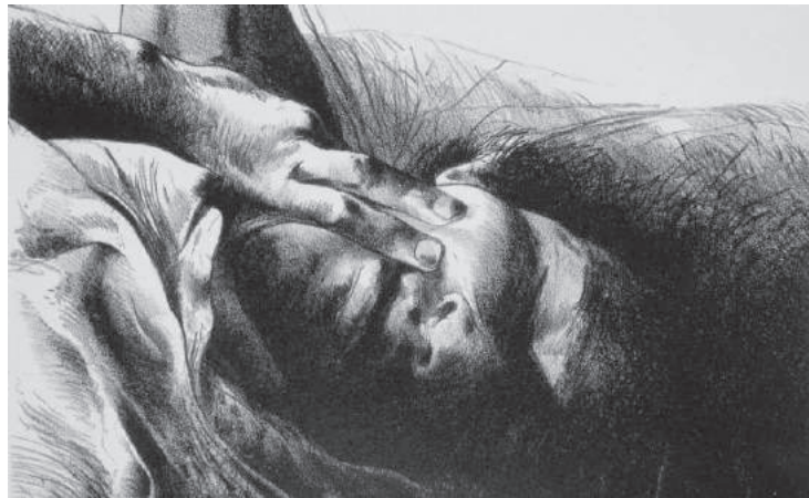
Luis Caballero, sin título (ilustración para el libro "La noche oscura" de San Juan de la Cruz), litografía sobre papel, 1977. No.34/60, 53 x 38 cm (Reg. 0801). Colección Banco de la República (detalle)

que tienen que decir los indios sobre la manera como son representados. Independientemente de la diversidad de respuestas a esta pregunta desde las identidades indígenas contemporáneas, hay que hacer visible la confrontación de estas posturas, las continuidades y discontinuidades y, sobre todo, los sentidos políticos implícitos. En esta vía, lejos de la intención de reificar la diferencia étnica, tal vez habría que proponer otros términos para la interlocución cultural.