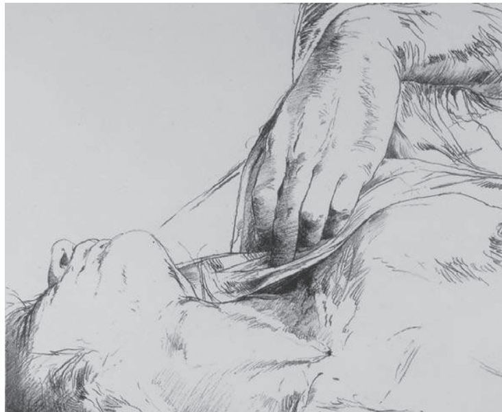
Luis Caballero, sin título (ilustración para el libro "La noche oscura" de San Juan de la Cruz), litografía sobre papel, 1977. No. 34/60, 53 x 38 cm (Reg 0796). Colección Banco de la República (detalle)

que hace tan resbaloso este tema es, al menos desde el punto de vista académico, la incapacidad de la ciencia occidental, como lugar de legitimación de saberes, para nombrar aquello que no comprende completamente, sin impedirse juzgarlo de antemano. En este sentido, creo que es necesario adentrarse un poco más en la genealogía de la Nueva Era para entender mejor la perspectiva desde donde ha sido concebida.