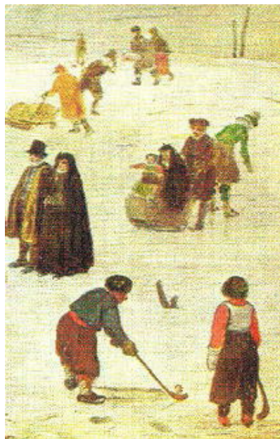
El juego de Kolf Holandés

Los que defienden que el origen del Golf está en Holanda se basan en este juego, llamado también kolf. Pero el parecido se queda en el nombre: este juego es básicamente de interior, aunque a veces se practique al aire libre o sobre el hielo; las bolas usadas son parecidas a las de cricket; los palos miden entre 1-2 m y tienen mangos rígidos, cabeza metálica, con cara plana para golpear la bola; y el objetivo era colar la pelota entre dos postes. Es probable que este juego influyera mucho más en el hockey (y sobre todo en el hockey sobre hielo).