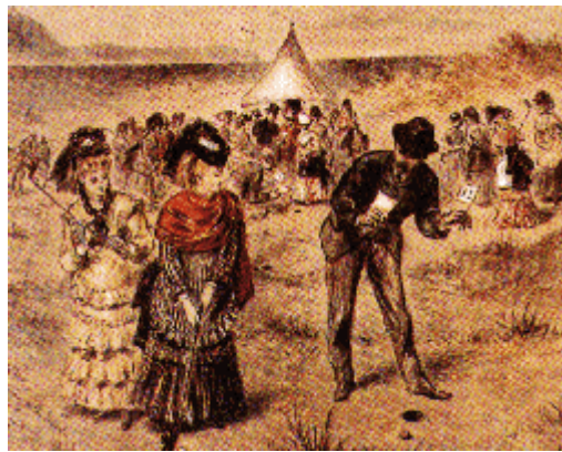
El Putting Green, en una pintura de 1872.

En 1848 un descubrimiento va a revolucionar el mundo del golf: se trata de la aparición de la gutapercha, resina que va a permitir fabricar bolas a un precio mucho más asequible que las antiguas realizadas en pluma, lo que supone la posibilidad de dar entrada a gran cantidad de personas de clases sociales más bajas. Este nuevo material era más duro y consecuentemente los palos sufrían mayor deterioro lo que supuso la sustitución de la madera por el hierro y la posibilidad de automatizar su fabricación.