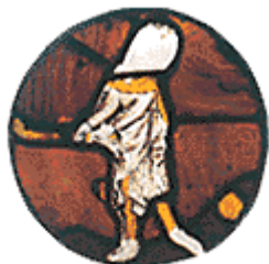
Gran Ventana Este de la Catedral de Gloucester