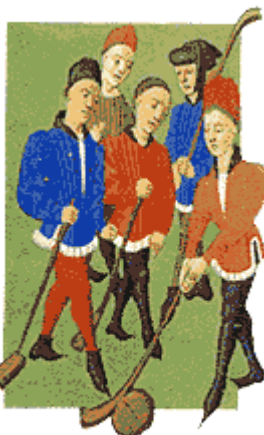
Jugadores de Chole. Imagen procedente del Libro de Horas de la Duquesa de Borgoña.

El Chole es un juego de origen belga y francés, posterior al jeu de mail (data de mediados del siglo XIV). Se empleaban palos con largos mangos de madera y bolas hechas de madera de haya o de cuero, rellenas de cualquier material (pelos de animales, fibras vegetales, etc.).