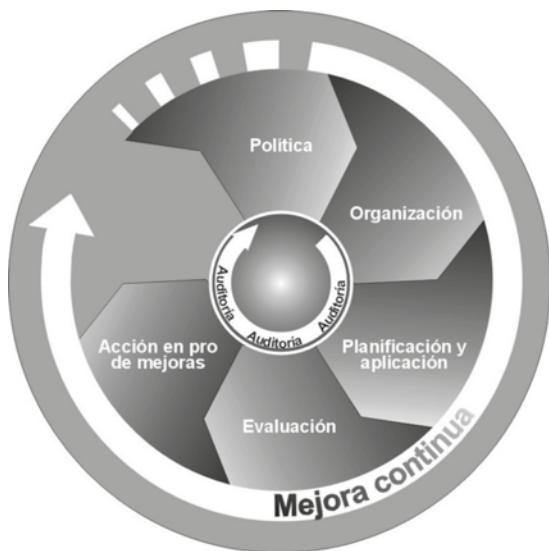
Gráfico 1. Elementos principales de un sistema de gestión de la SST

cuenten además con un sistema de gestión medioambiental que identifique el impacto ambiental y facilite el establecimiento de objetivos de desempeño ambiental y la medición de los progresos.