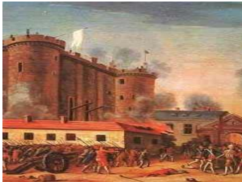
Toma de la Bastilla por el pueblo parisino La Bastilla símbolo de opresión de la Monarquía Absoluta

acceder al voto, suffragio censitario , la Constitución disponía que el electorado quedara limitado a las clases altas y media. El nuevo estatuto confería el poder legislativo a la Asamblea Nacional, compuesta por 745 miembros elegidos por un sistema de votación indirecto. Aunque el rey seguía ejerciendo el poder ejecutivo, se le impusieron estrictas limitaciones. Su poder de veto tenía un carácter meramente suspensivo, y era la Asamblea quien tenía el control efectivo de la dirección de la política exterior. El poder judicial sería desempeñado por jueces elegidos por el pueblo. Quedaba abolido el absolutismo, estableciéndose un régimen de monarquía constitucional, claramente favorable a los intereses de la nueva clase emergente: la burguesía adinerada .